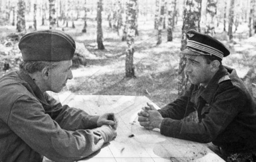
Писатель Илья Эренбург беседует с французским летчиком полка "Нормандия - Неман". 1943 г.