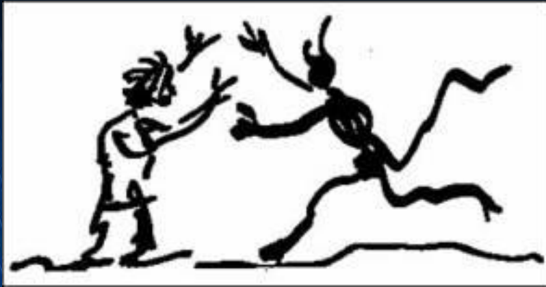
Шарж Пикассо, в котором он изобразил себя и Эренбурга

Во Франции Эренбург жил очень бедно. По воспоминаниям Максимилиана Волошина, «материальное положение Ильи Э. было ужасно. Он ходил, чтобы подработать, ночным носильщиком на вокзал Монпарнас и возил вагонетки до рассвета. При его слабосильности и болезненности — меня это приводило в ужас».