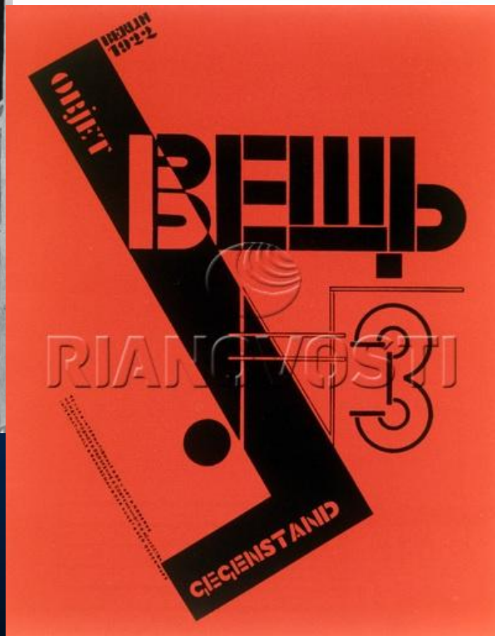
Репродукция обложки международного журнала искусств, основанного художником Элем (Лазарь Маркович) Лисицким и писателей Ильей Эренбургом "Вещь". 1922 год