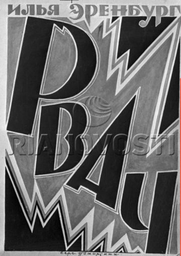
Репродукция обложки книги Ильи Эренбурга "Рвач"