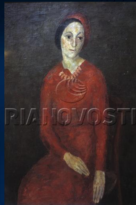
Роберт Фальк. Картина "Портрет жены писателя Ильи Эренбурга".