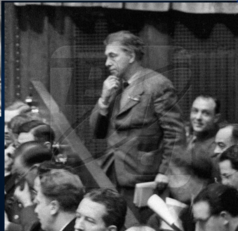
Илья Эренбург в зале заседаний Международного Военного Трибунала на Нюрнбергском процессе. 1945 г.