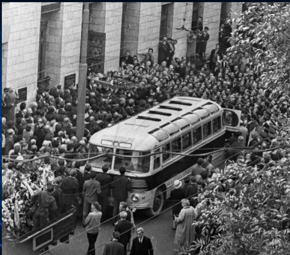
Люди, пришедшие к Центральному Дому литераторов, провожают в последний путь писателя Илью Эренбурга