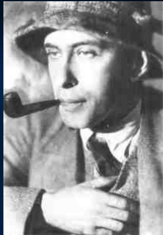
Илья Эренбург в 20-е годы