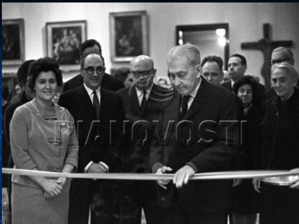
Илья Григорьевич Эренбург открывает выставку произведений Пабло Пикассо в Музее изобразительных искусств имени А. С. Пушкина.

В 1955-1957 гг. Эренбург написал ряд литературно-критических эссе о французском искусстве под общим названием "Французские тетради". В 1956 г. он добился проведения в Москве первой выставки Пабло Пикассо.