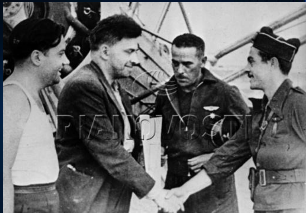
Репродукция фотографии писателя Ильи Эренбурга на аэродроме в Каталонии (Испания).

Сталин - еженедельная газета 25-й смешанной интербригады