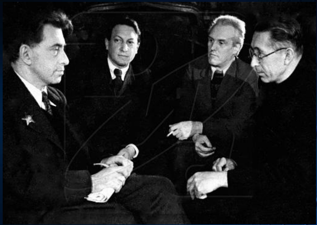
Советские писатели (слева направо): И. Эренбург (1892 - 1967 г. г.), В. Каверин (1902 - 1988 г. г.), Н. Тихонов (1896 - 1979 г. г.), Б. Лавренев (1891 - 1959 г. г.).

После захвата Франции немцами в 1940 г. Эренбург окончательно вернулся в СССР, где начал писать роман "Падение Парижа", первая часть которого вышла в начале 1941 года, полностью роман был опубликован в 1942 г. В том же году роман был удостоен Государственной (Сталинской) премии.