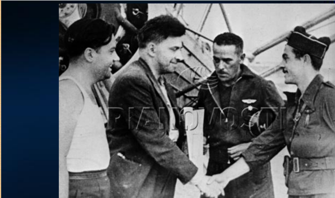
Репродукция фотографии писателя Ильи Эренбурга на аэродроме в Каталонии (Испания).