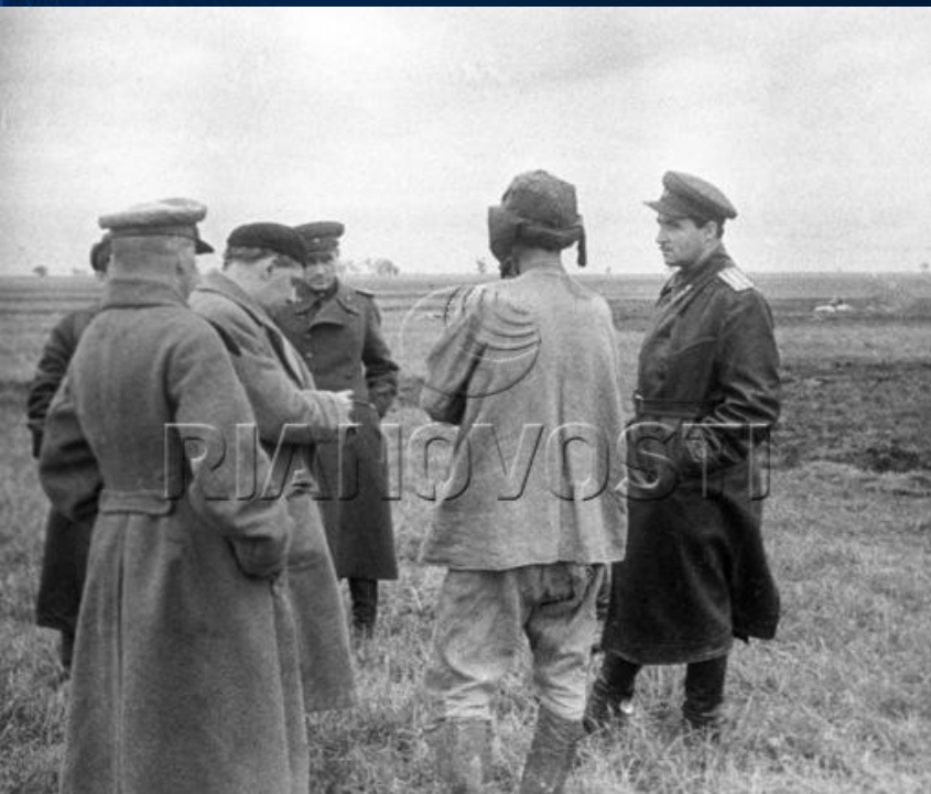
Советские писатели И. Эренбург и К. Симонов (справа) на фронте в Белоруссии. Фотография 1943 года.