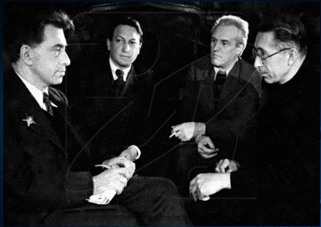
Советские писатели (слева направо): И. Эренбург (1892 - 1967 г. г.), В. Каверин (1902 - 1988 г. г.), Н. Тихонов (1896 - 1979 г. г.), Б. Лавренев (1891 - 1959 г. г.).

После захвата Франции немцами в 1940 г. Эренбург окончательно вернулся в СССР, где начал писать роман "Падение Парижа", первая часть которого вышла в начале 1941 года, полностью роман был опубликован в 1942 г. В том же году роман был удостоен Государственной (Сталинской) премии.