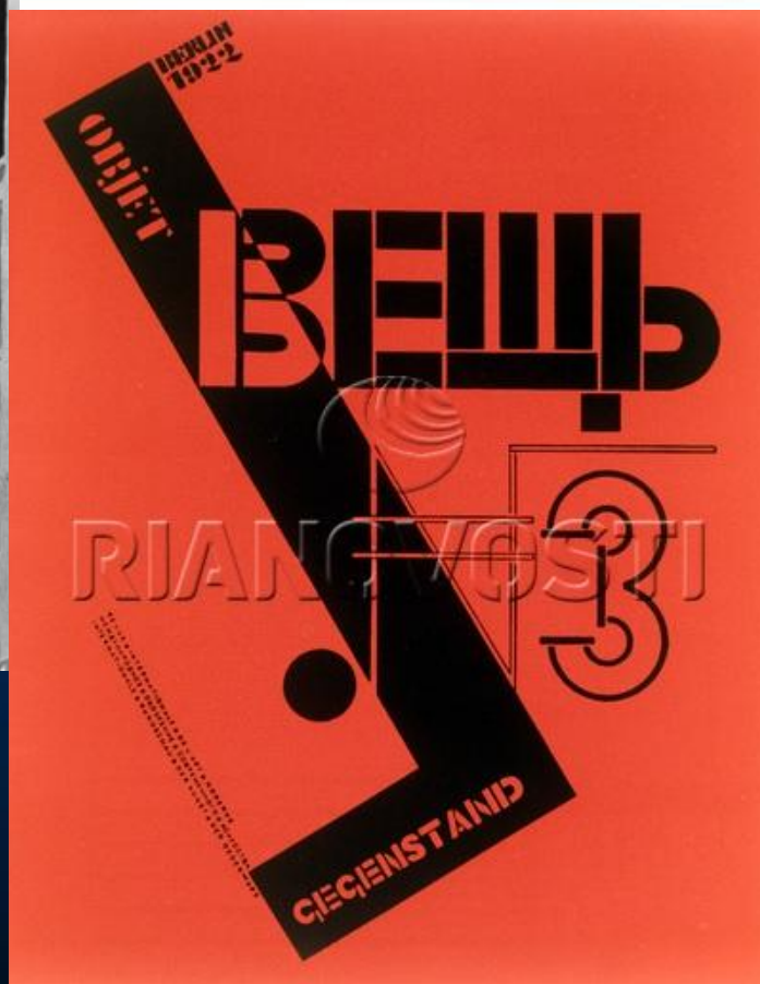
Репродукция обложки международного журнала искусств, основанного художником Элем (Лазарь Маркович) Лисицким и писателей Ильей Эренбургом "Вещь". 1922 год