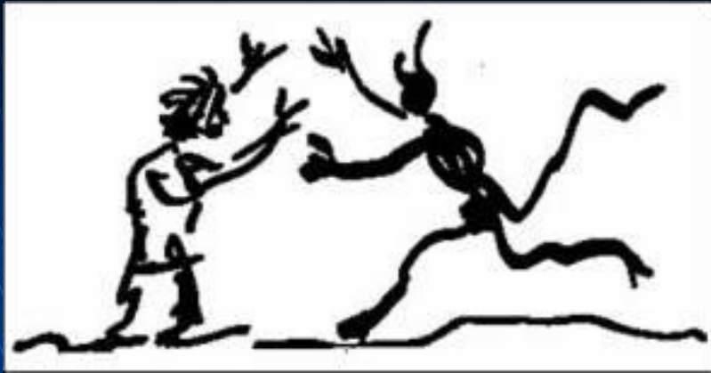
Шарж Пикассо, в котором он изобразил себя и Эренбурга

Во Франции Эренбург жил очень бедно. По воспоминаниям Максимилиана Волошина, «материальное положение Ильи Э. было ужасно. Он ходил, чтобы подработать, ночным носильщиком на вокзал Монпарнас и возил вагонетки до рассвета. При его слабосильности и болезненности — меня это приводило в ужас».