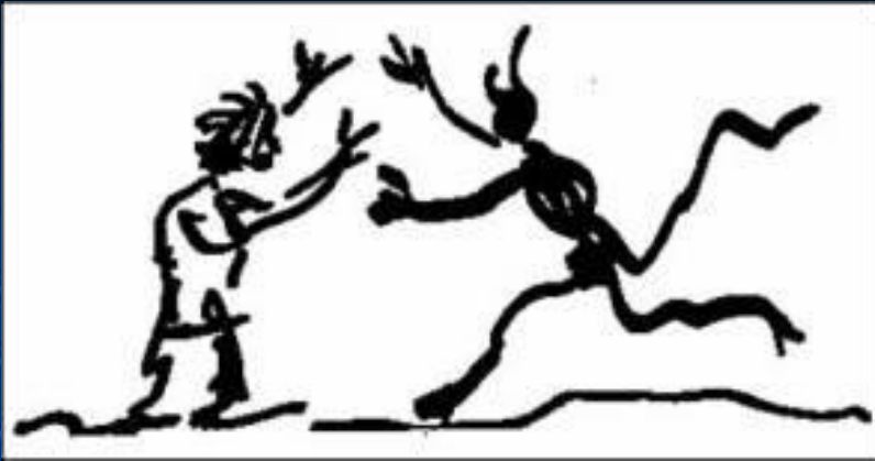
Шарж Пикассо, в котором он изобразил себя и Эренбурга

Во Франции Эренбург жил очень бедно. По воспоминаниям Максимилиана Волошина, «материальное положение Ильи Э. было ужасно. Он ходил, чтобы подработать, ночным носильщиком на вокзал Монпарнас и возил вагонетки до рассвета. При его слабосильности и болезненности — меня это приводило в ужас».