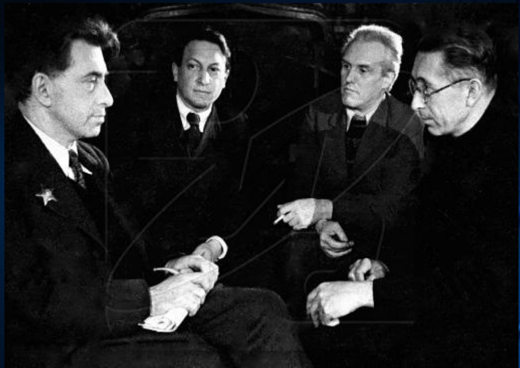
Советские писатели (слева направо): И. Эренбург (1892 - 1967 г. г.), В. Каверин (1902 - 1988 г. г.), Н. Тихонов (1896 - 1979 г. г.), Б. Лавренев (1891 - 1959 г. г.).

После захвата Франции немцами в 1940 г. Эренбург окончательно вернулся в СССР, где начал писать роман "Падение Парижа", первая часть которого вышла в начале 1941 года, полностью роман был опубликован в 1942 г. В том же году роман был удостоен Государственной (Сталинской) премии.