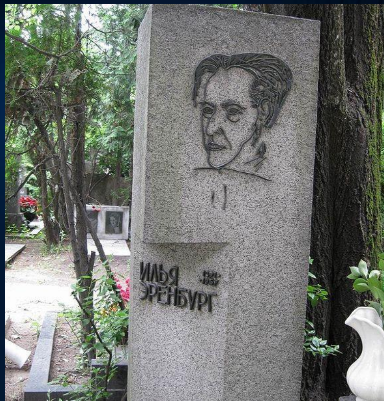
Через год на могиле был поставлен памятник, на котором выбит профиль Эренбурга по рисунку его друга Пабло Пикассо.