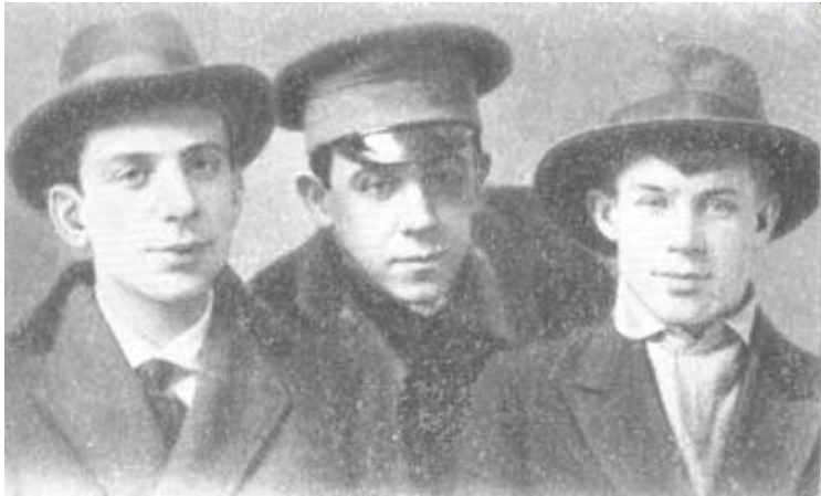
Рюрик Ивнев, В.С. Чернявский, С.А. Есенин