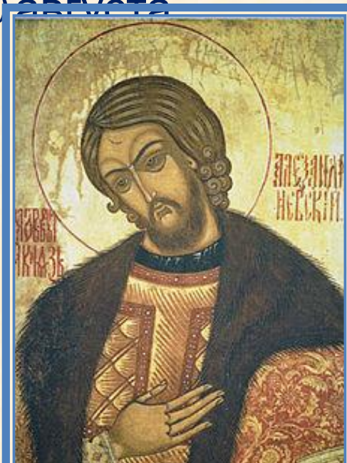
Икона Святого благоверного