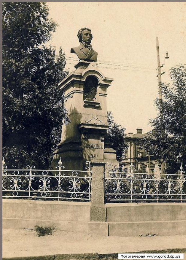
Памятник в Днепропетровске, спасенный горожанами в годы войны