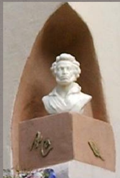
Фасад здания Русского культурного центра во Львове после нападения (уничтожен бюст А.С.Пушкина)