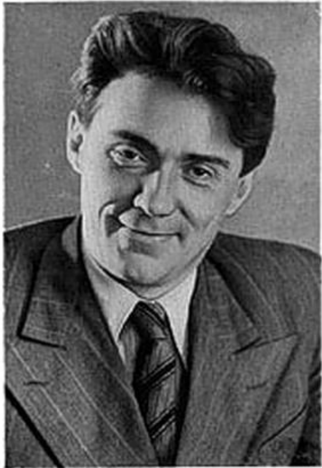
Борис Николаевич ПОЛЕВОЙ