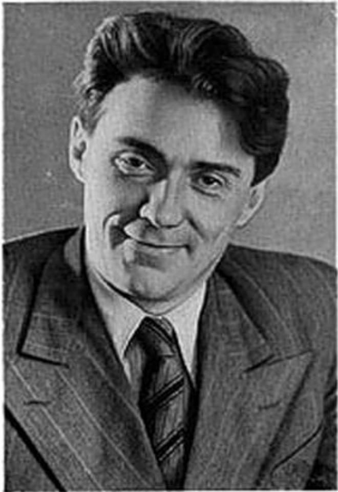
Борис Николаевич ПОЛЕВОЙ