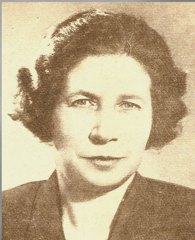
Валентина Александровна Осеева