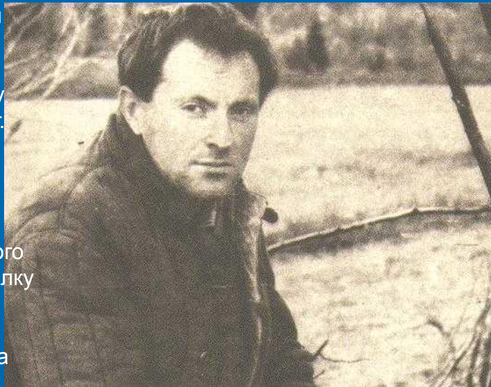
Бродский на полевых работах в ссылке.

Годы спустя в интервью Майклу Скаммелю на вопрос: «Как на Вашу работу повлияли суд и заключение?» Бродский ответил: «Вы знаете, я думаю, это даже пошло мне на пользу, потому что те два года, которые я провел в деревне, – самое лучшее время моей жизни. Я работал тогда больше, чем когда бы то ни было. Днем мне приходилось выполнять физическую работу, но поскольку это был труд в сельском хозяйстве, а не работа на заводе, существовало много периодов отдыха, когда делать нам было нечего».