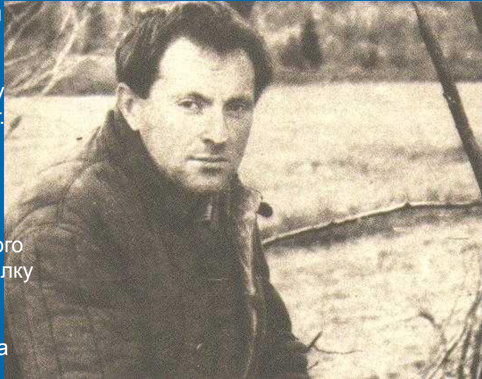
Бродский на полевых работах в ссылке.

Годы спустя в интервью Майклу Скаммелю на вопрос: «Как на Вашу работу повлияли суд и заключение?» Бродский ответил: «Вы знаете, я думаю, это даже пошло мне на пользу, потому что те два года, которые я провел в деревне, – самое лучшее время моей жизни. Я работал тогда больше, чем когда бы то ни было. Днем мне приходилось выполнять физическую работу, но поскольку это был труд в сельском хозяйстве, а не работа на заводе, существовало много периодов отдыха, когда делать нам было нечего».