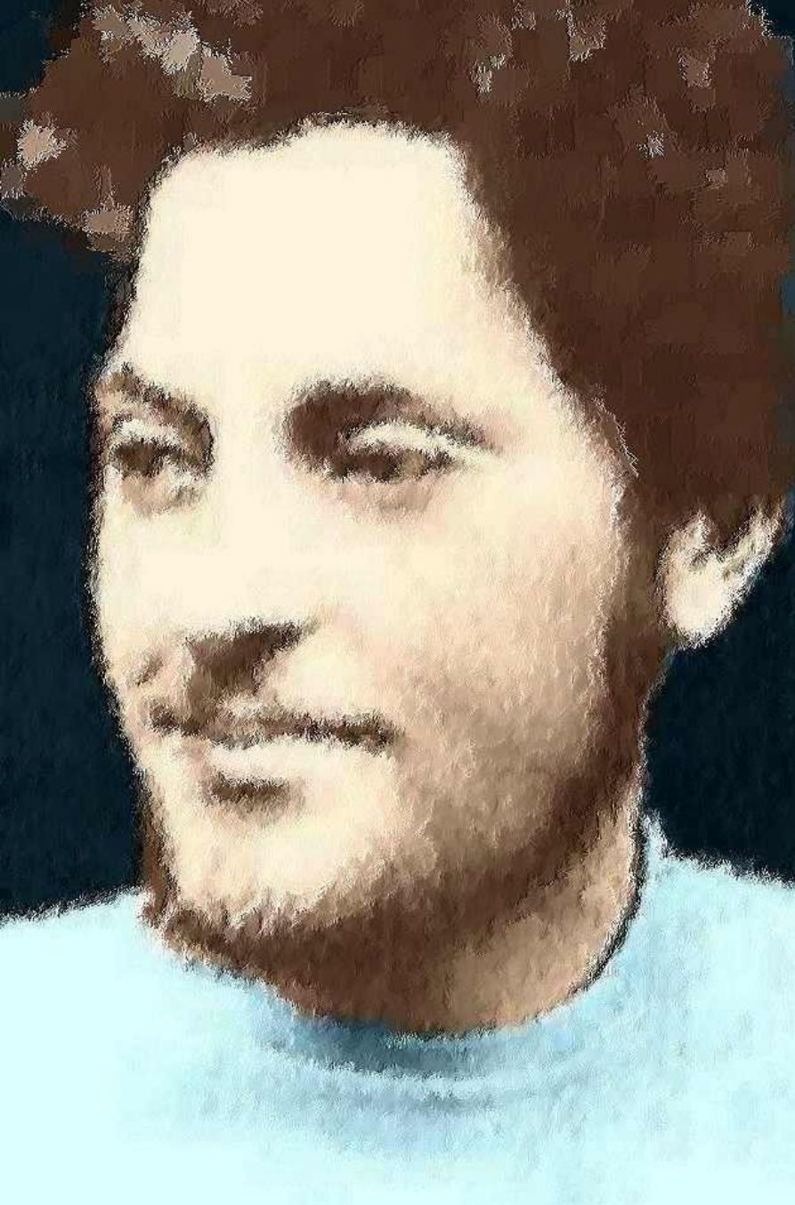
ИОСИФ БРОДСКИЙ (1940-1996)