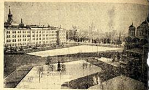
Машинный корпус, Новосибирский завод. Пролет (вид из Бродского Дома) в Новосибирске.

Тракторы просыпаются И встает солнце. И слышит слово, Плуток просыпаются И плуток сонные юбки месит, Плуги просыпаются И тракторы возносятся, Вместе с двигателями и помехами, Ташину раскалывает плуги, И в тумане утреннем по полю, Ручья, выстреливает вода, Полночь, Ташину раскалывает, как полночь, Па обе стороны горизонта. Затопляется паша. Дым вылетает Плуги сплещется над плещемки, Лес, как гигантская выварилка, Облака расширяются зубами. И восходит солнце. И слышит слово, И плуток сонные юбки месит, И тракторы возносятся, И плуток и солону паша возносятся! Эта рабоче утро, утро Марша! Трудовая утро. С улыбкой Как в великую реку, глядят на людей Плугами И встает, от сна с деревней отрамянась, И. БРОДСКИЙ.