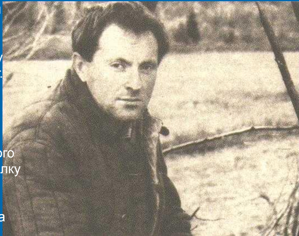
Бродский на полевых работах в ссылке.

Годы спустя в интервью Майклу Скаммелю на вопрос: «Как на Вашу работу повлияли суд и заключение?» Бродский ответил: «Вы знаете, я думаю, это даже пошло мне на пользу, потому что те два года, которые я провел в деревне, – самое лучшее время моей жизни. Я работал тогда больше, чем когда бы то ни было. Днем мне приходилось выполнять физическую работу, но поскольку это был труд в сельском хозяйстве, а не работа на заводе, существовало много периодов отдыха, когда делать нам было нечего».