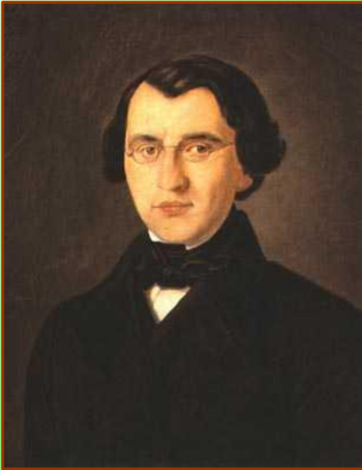
Тургенев в возрасте 26 лет. 1844 год