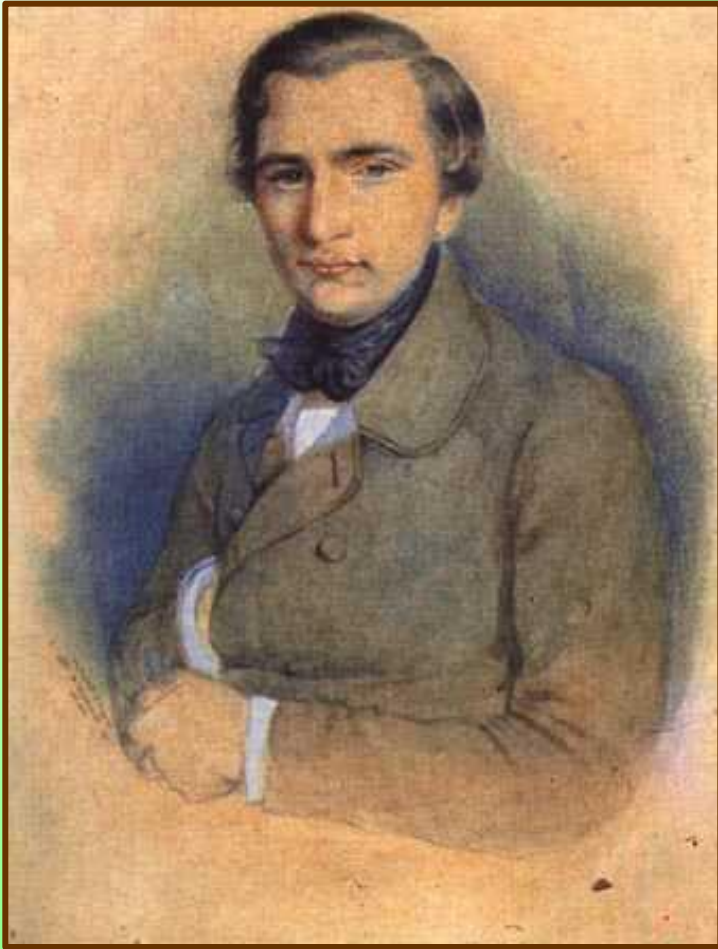
Тургенев в возрасте 20 лет. 1838 год

В 1836 г. Тургенев окончил курс со степенью действительного студента. Мечтая о научной деятельности, он в следующем году снова держал выпускной экзамен, получил степень кандидата, а в 1838 г. отправился в Германию. Поселившись в Берлине, Тургенев усердно взялся за занятия.