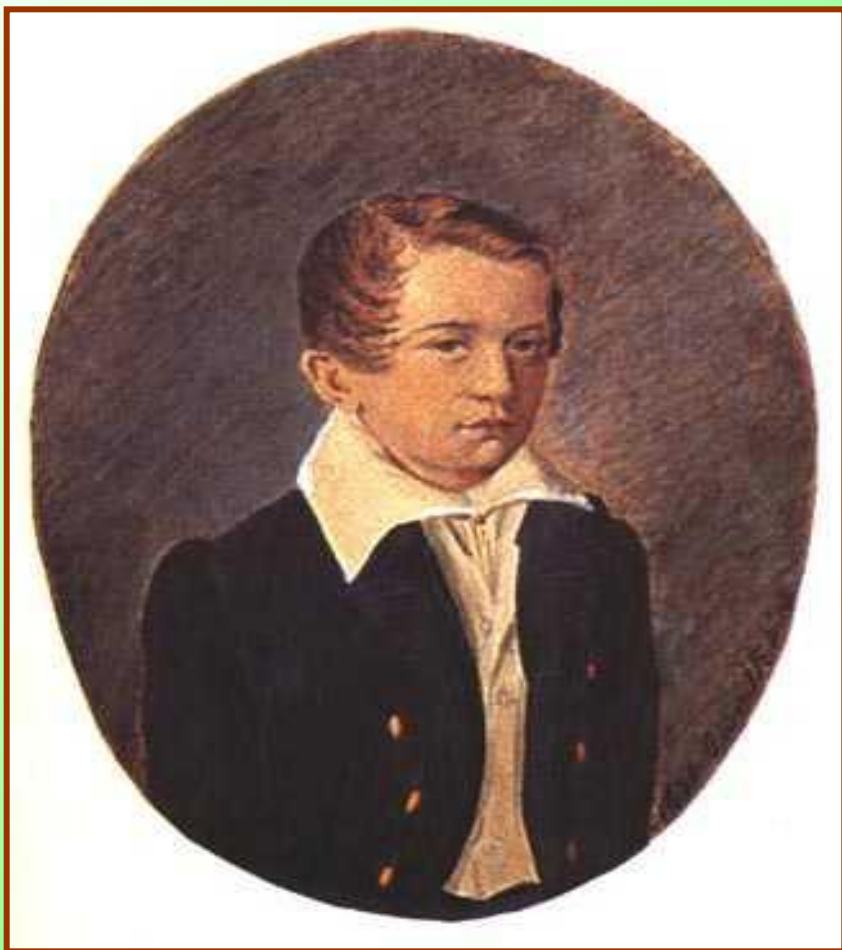
Тургенев в возрасте 12 лет. 1830 год

В 1833 г. 15-летний Тургенев (такой возраст студентов, при тогдашних невысоких требованиях, был явлением обычным) поступил на словесный факультет Московского университета. Год спустя, из-за поступившего в гвардейскую артиллерию старшего брата, семья переехала в Санкт-Петербург, и Тургенев тогда же перешел в Петербургский университет