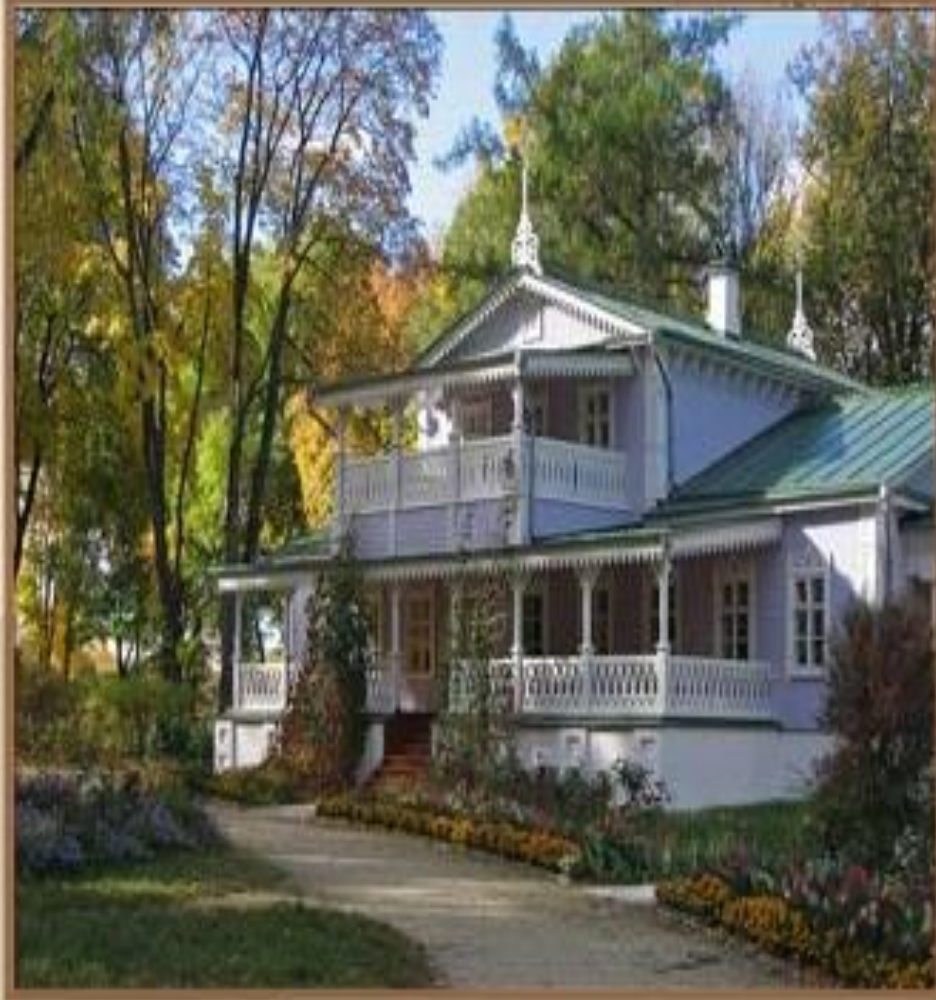
Спасское - Лутовиново (Усадебный дом)

На первых порах их семейной жизни в Спасском-Лутовинове, кроме охоты, устраивались балы, маскарады, спектакли: «Свой оркестр, свои певчие, свой театр с крепостными актерами - все было в вековом Спасском для того, чтобы каждый добивался чести быть там гостем».