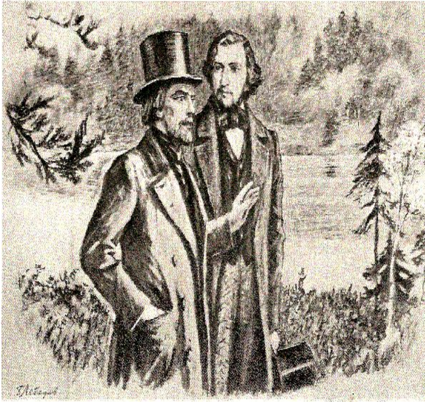
В.Г.Белинский и И.С. Тургенев

На причины популярности тургеневского очерка впервые указал Белинский: "Не удивительно, что маленькая пьеска эта имела такой успех: в ней автор зашел к народу с такой стороны, с какой до него к нему никто еще не заходил".