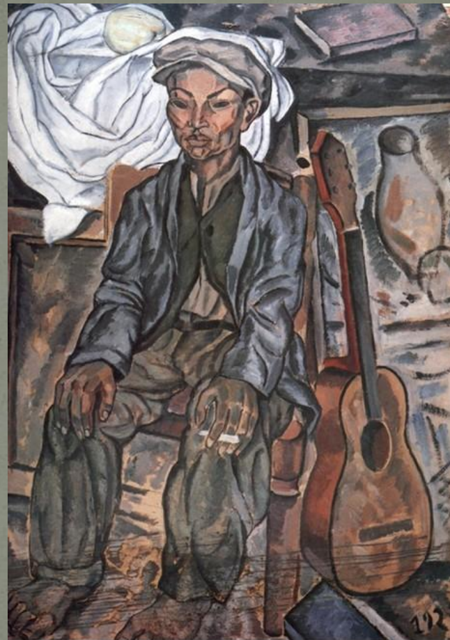
Цыган из Фигераса, 1923. Картон, масло.