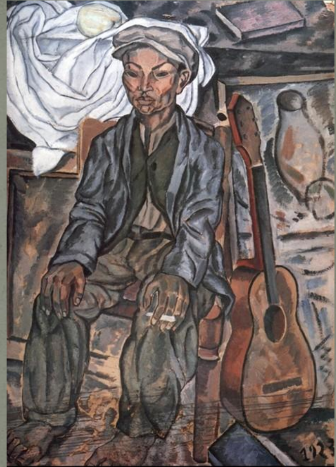
Цыган из Фигераса, 1923. Картон, масло.