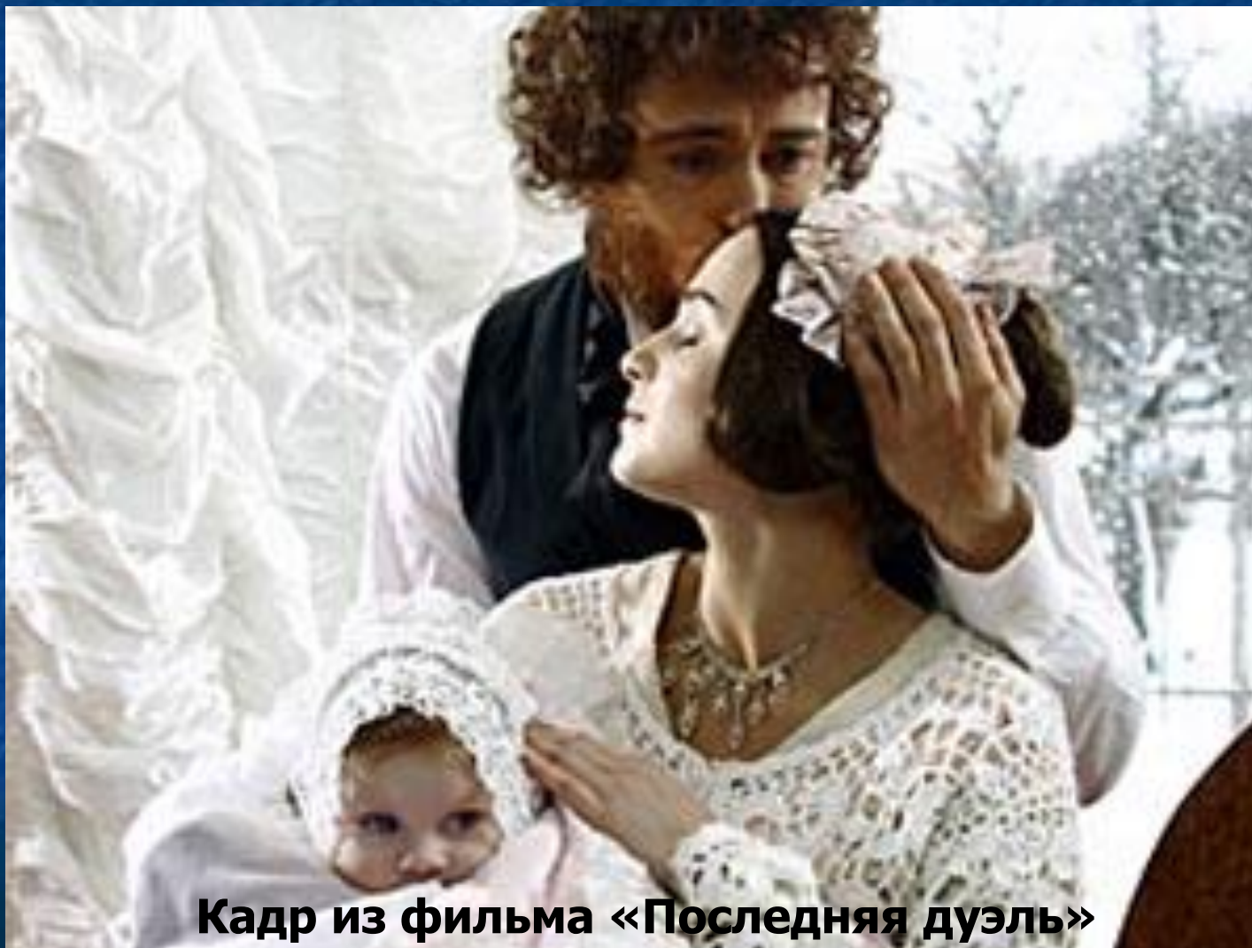
Кадр из фильма «Последняя дуэль»