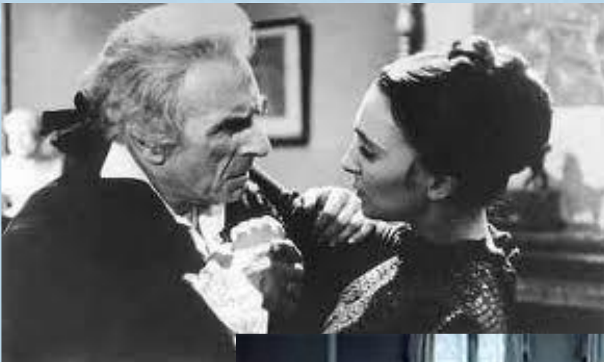
Княжна Марья и ее отец, князь Болконский (Кадры из фильма)