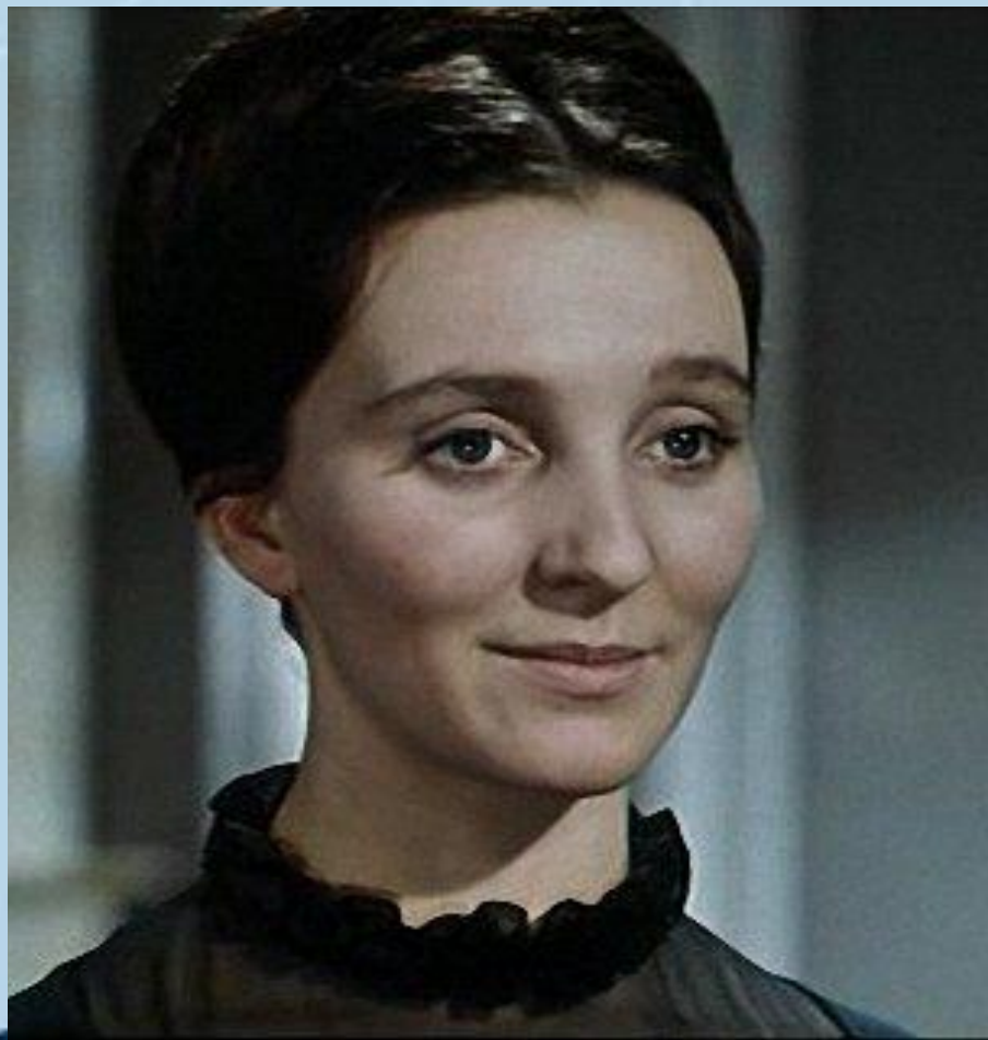
Марья Болконская. (Кадр из фильма)