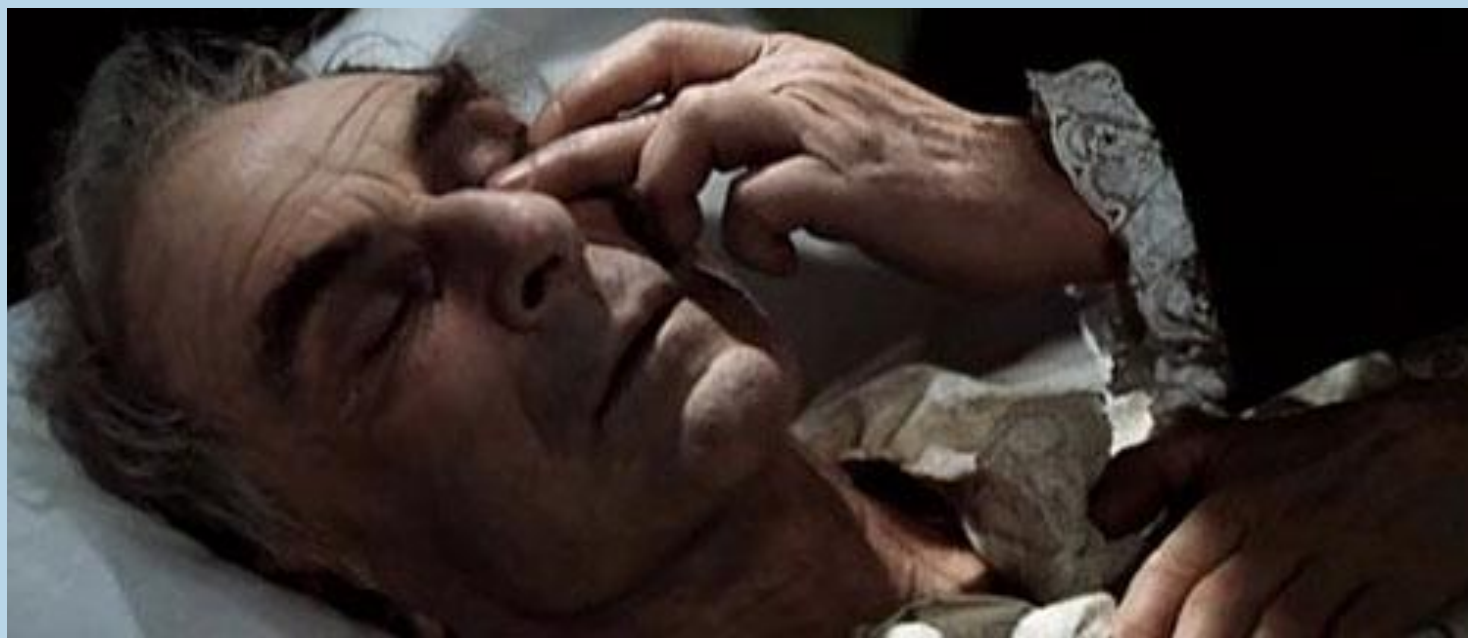
Смерть старого князя