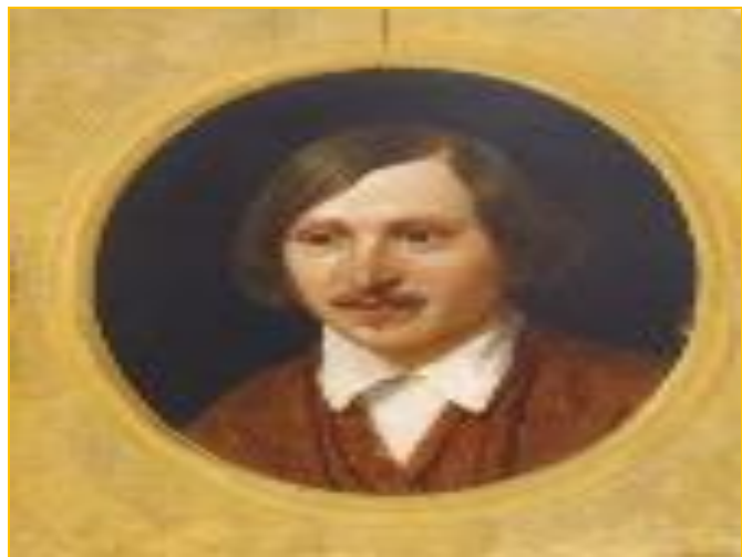
Н.В.Гоголь 1841 г. худ. А.А.Иванов