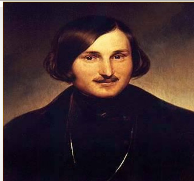
Н.В.Гоголь 1841 г. худ. Ф.А.Моллер