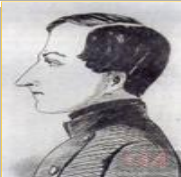
Гоголь - гимназист. Неизвестный художник