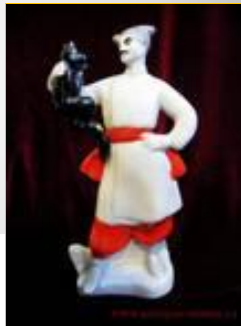
2 – я команда «Вакула»