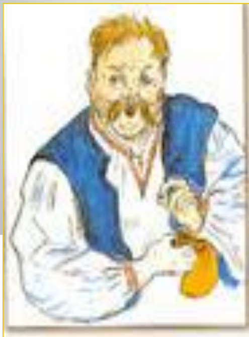
1 –я команда «Рудой Панька»