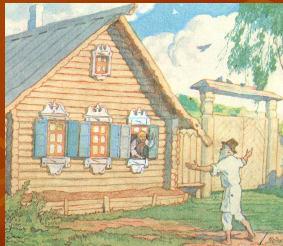
Иллюстрация к «Сказке о рыбаке и рыбке»

Я решила проверить каждую из гипотез, чтобы выяснить, что же является истиной.