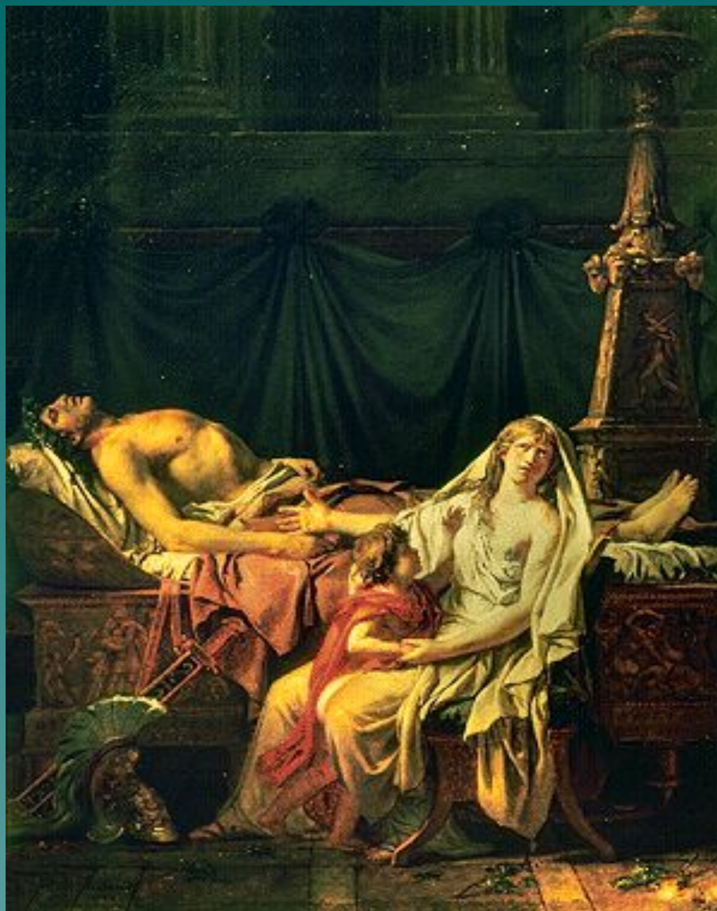
Ж.Л. Давид. «Андромаха у ног Гектора». 1783.

Музей изобразительных Искусств им. А.С. Пушкина