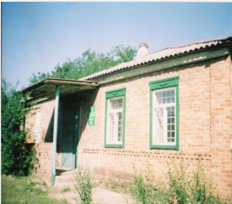
На фото: бывшее здание библиотеки, в прошлом кулацкий дом, ныне здание Сбербанка

В 1955 году библиотека переместилась в другое здание на улицу Ленина. В одной из комнат расположилась библиотека, а в другой - класс начальной школы.