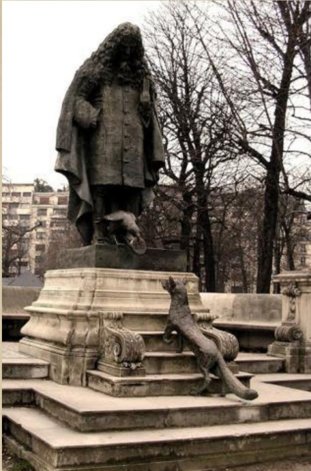
Памятник Жану де Лафонтену в Париже. Французский баснописец с персонажами своей басни.

Древний жанр в XVII веке возвеличил Жан де Лафонтен. Французский писатель создал новаторский стиль в написании басен. В его творениях нет как таковых нравоучений. Писатель пытался раскрыть настоящий смысл жизни, суть добра и зла на земле.