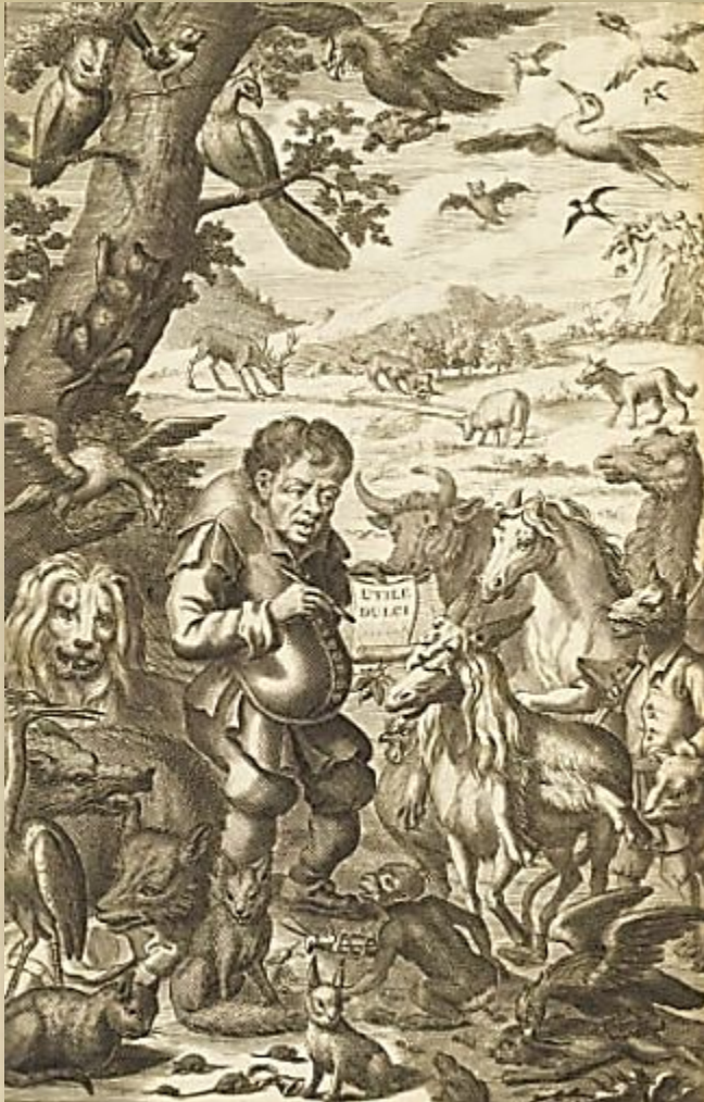
Роджер L'Estrange. Эзоповы басни

Сами древнегреческие ученые признавали, что басни ассирийцев и вавилонян повлияли на творчество Эзопа. Он стал автором сюжетов почти всех известных в античности басен, которые были собраны в сборники «Эзоповы басни» еще в IV - III веках до н. э. В XIV-XV веках эти сборники выходили в самых разных редакциях.