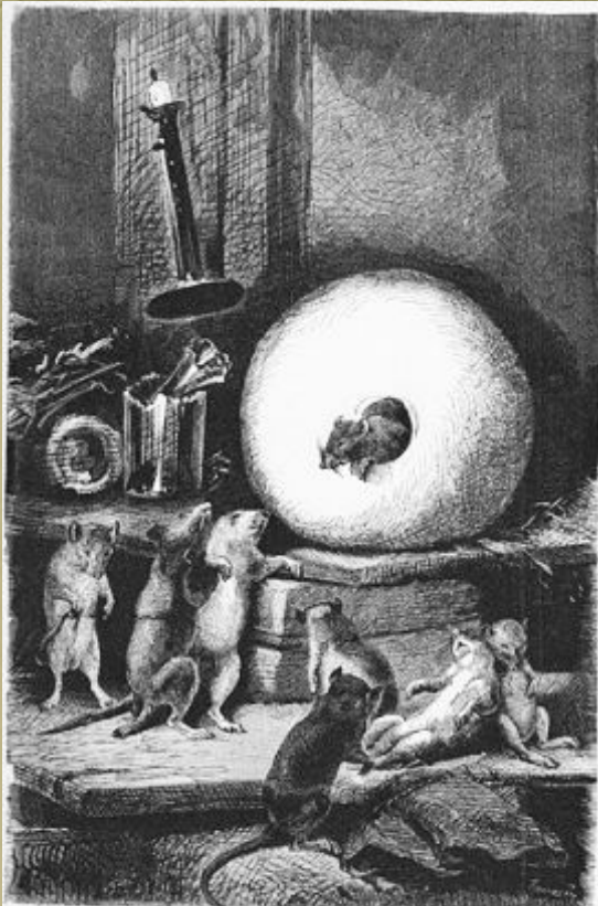
Мышь, удалившаяся от света

Лафонтен создал ярких и красочных персонажей, героев басен, которые помогли автору воспроизвести запоминающиеся истории.