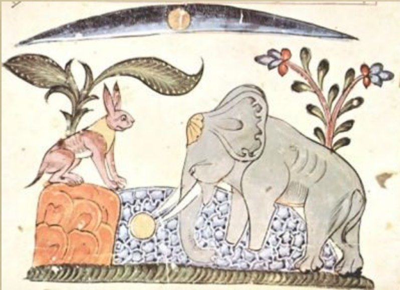
Герои «Панчатантры». Сирийская иллюстрация к «Калиле и Димне».

Шумеро-вавилонская басня стала истоком и индийской басни. Сборник басен «Панчатантра» относится к III веку. Это знаменитое собрание индийских басен и рассказов в 5 книгах составлено брахманом Вишнусарманом для наставления царских детей. «Панчатантра» очень рано была переведена на различные азиатские и европейские языки и послужила источником для целого ряда странствующих повестей и сказок.