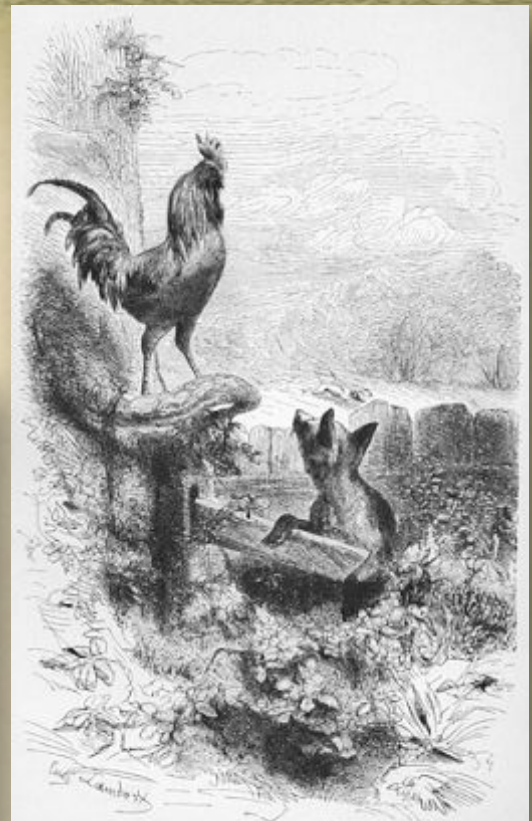
Петух и лиса