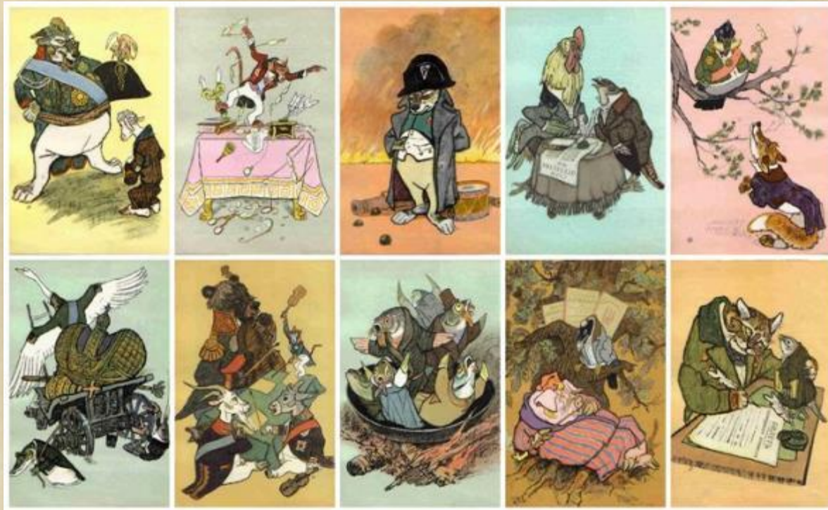
Герои басен Крылова. Иллюстрации Е.М. Рачёва.

Самую широкую известность получили басни, созданные И.А. Крыловым (1769-1844). Многие выражения из басен Крылова стали крылатыми.