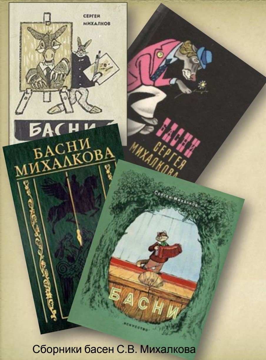
Сборники басен С.В. Михалкова

В XX веке к басне на разном этапе творчества обращались Д. Бедный, С.И. Олейник, С. В. Михалков. Басни Михалкова – это меткое оружие сатиры. Ими зачитывалась вся страна. Они популярны до сих пор. Маститый автор, разделивший все радости и горести своего народа, ясно видящий хорошее и плохое, сумел в лучших традициях басенного творчества показать человеческие слабости и пороки. Басня, получившая новый виток развития в XX веке, актуальна и по сей день.