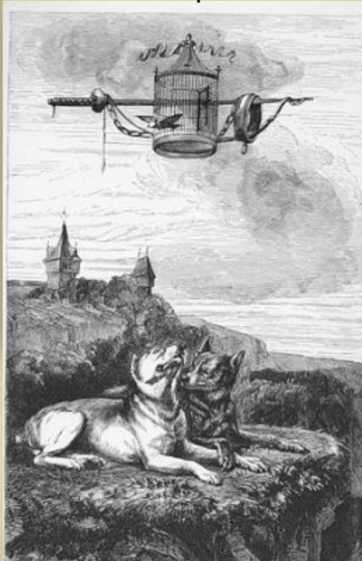
Волк и Неволя

Лафонтен создал ярких и красочных персонажей, героев басен, которые помогли автору воспроизвести запоминающиеся истории.