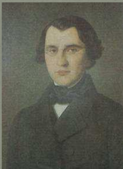
1843 – 1844-е годы