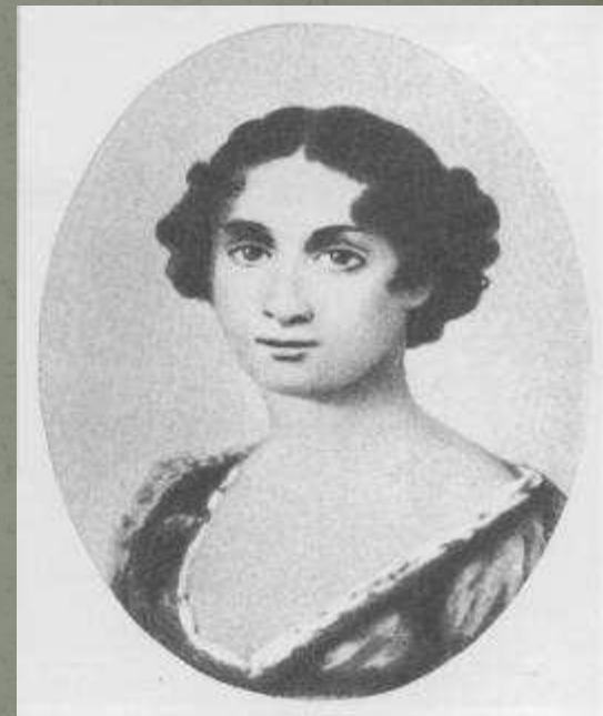
В. П. Тургенева — мать писателя