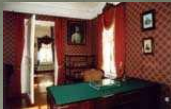
Рабочая комната писателя