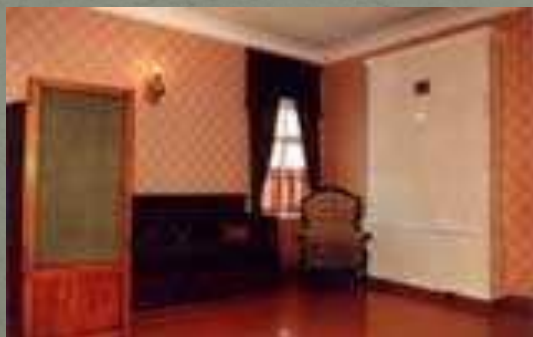
Комната Захара Балашова