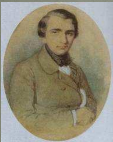
1838 – 1839-е годы