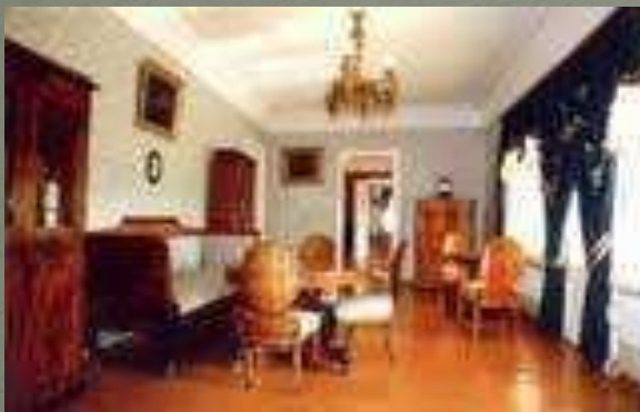
Комната для отдыха