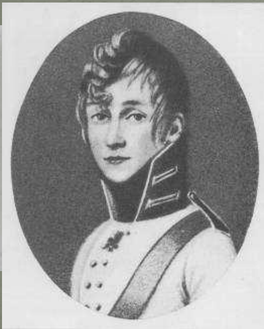
С. Н. Тургенев — отец писателя