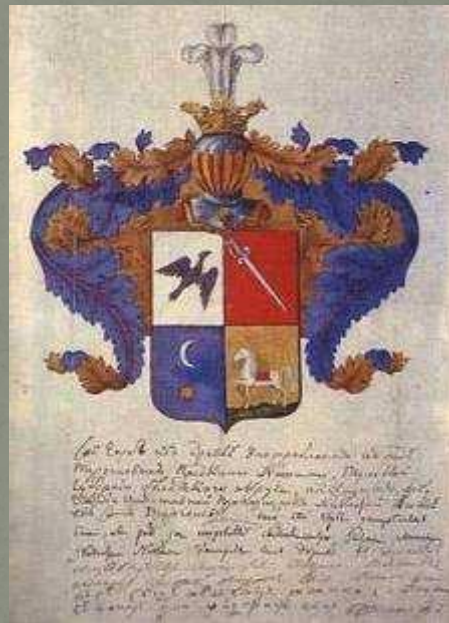
Герб рода Тургеневых