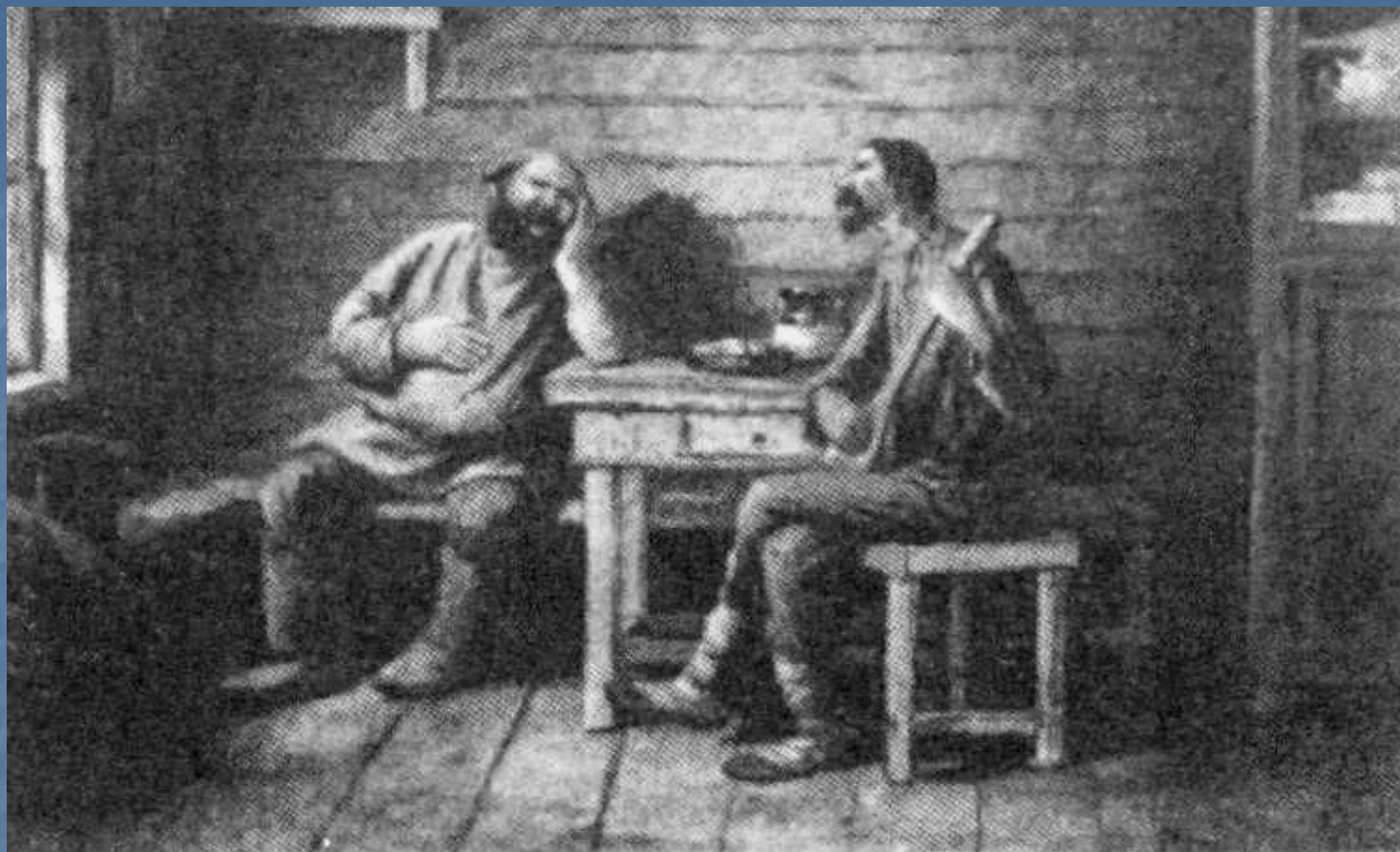
Рассказ «Хорь и Калиныч». Иллюстрация художника П.Соколова. 1891 год.