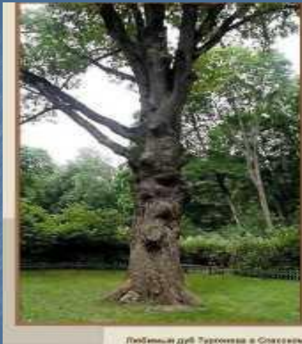
Победный дуб Тургенева в Спасском

Когда вы будете в Спасском, поклонитесь от меня дому, саду, моему молодому дубу, родине поклонитесь, которую я уже, вероятно, никогда не увижу» ( из письма Тургенева Я.П. Полонскому, 30 мая 1882 года)