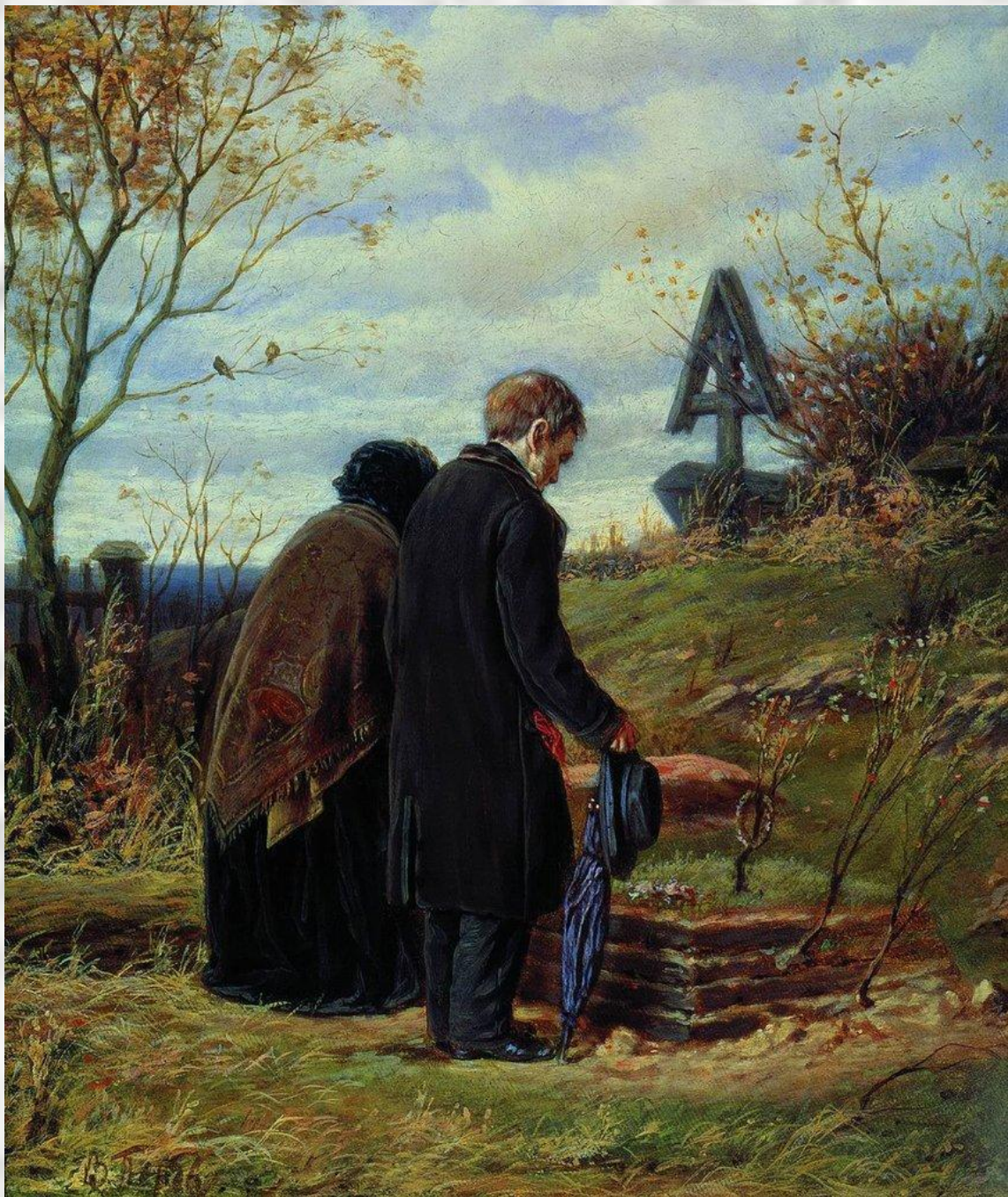
Василий Перов. Старики-родители на могиле сына. 1874. Холст, масло. Третьяковская Галерея, Москва, Россия.