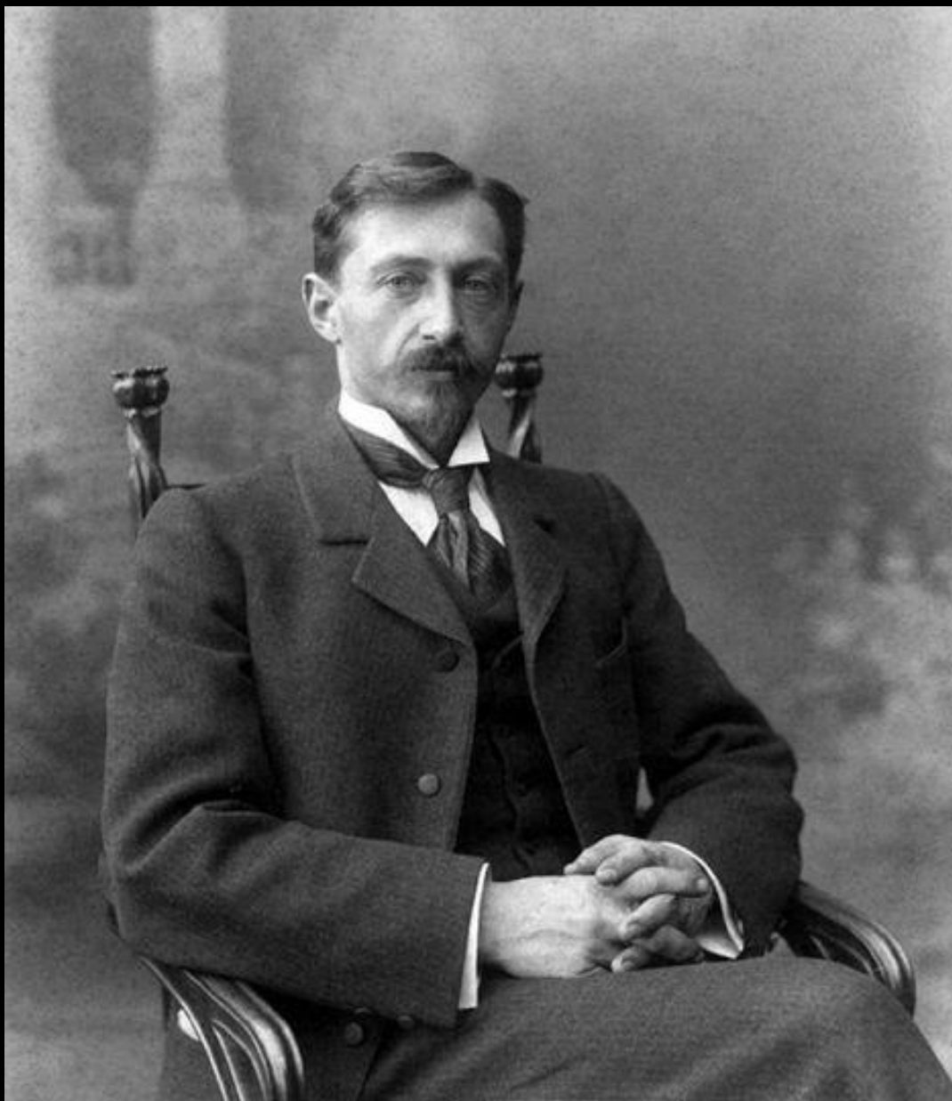
ПОРТРЕТ ПИСАТЕЛЯ И. БУНИНА. НИЖНИЙ НОВГОРОД.