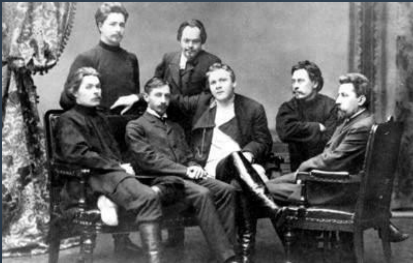
М. Горький, И. Бунин, Ф. Шаляпин. Скиталец (С. Петров), Н. Телешов, Л. Андреев, Е. Чириков.