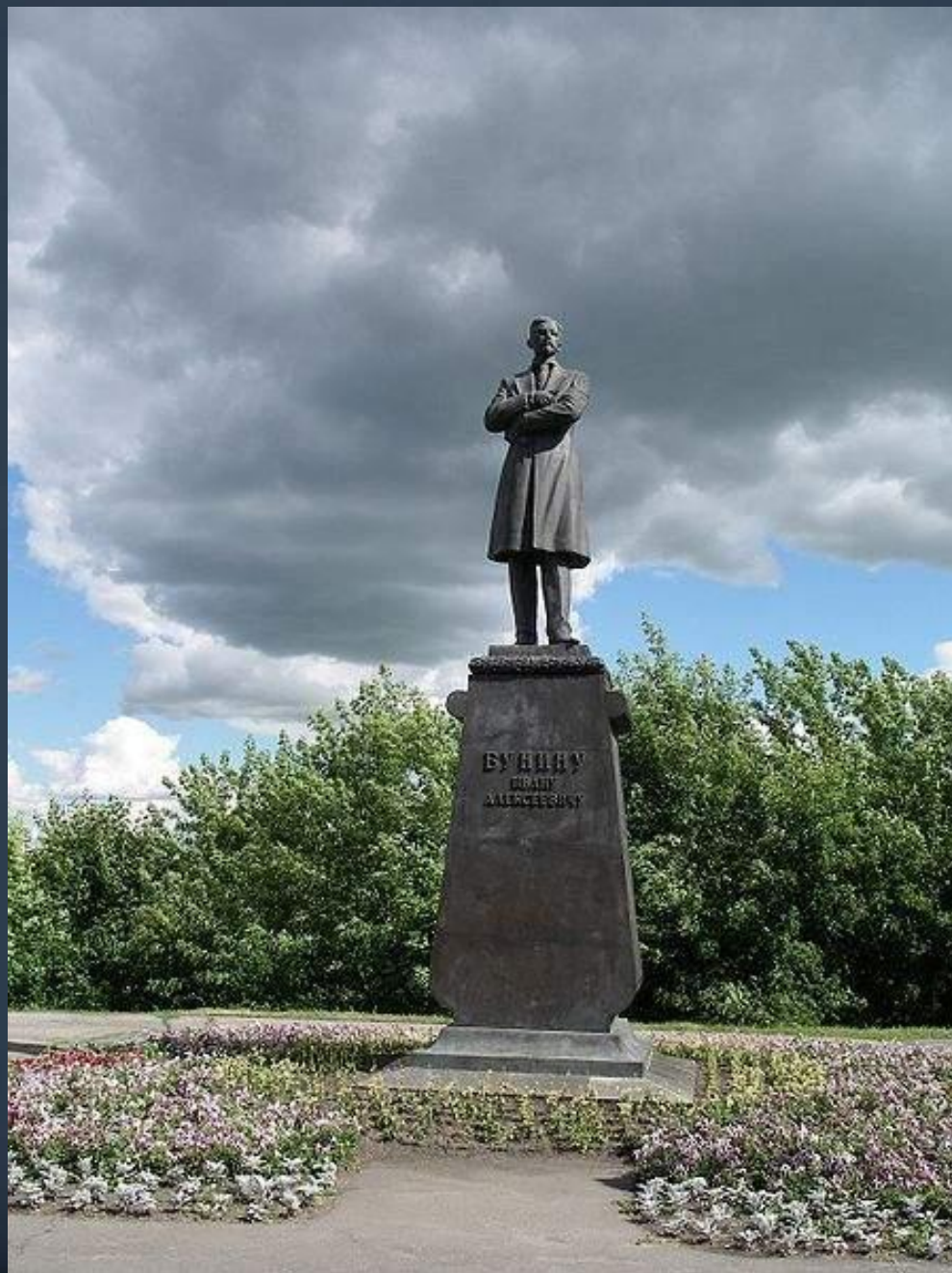
Памятник Ивану Бунину в г. Орле