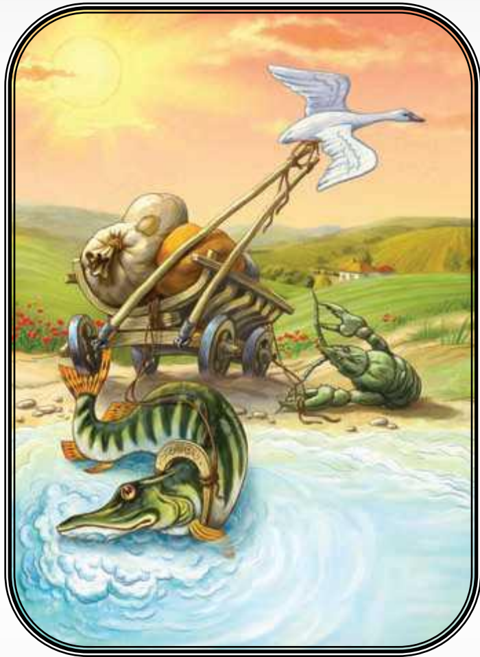
Лебедь, Щука и Рак