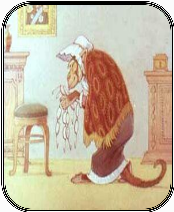
Мартышка и очки