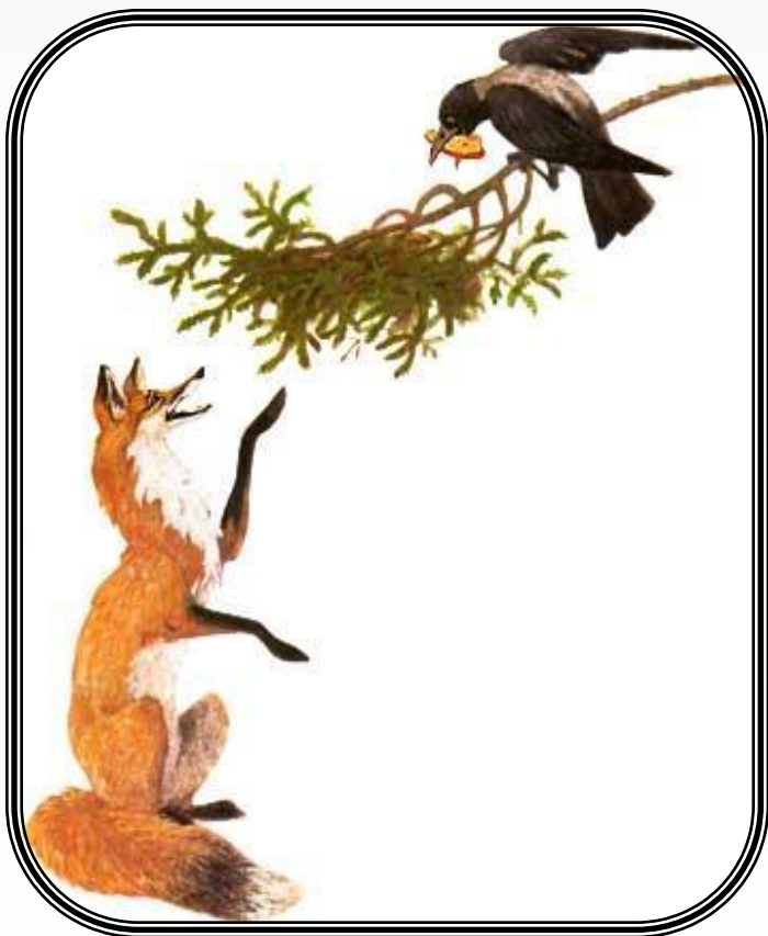
Ворона и Лиса