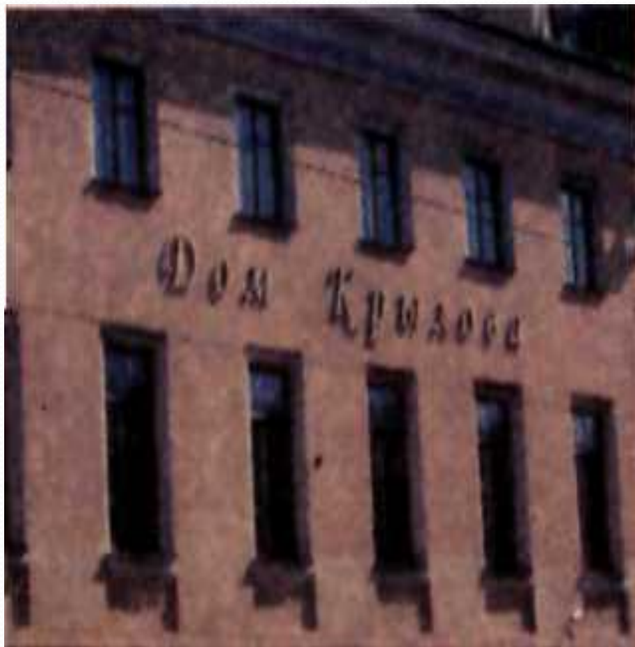
« Дом Крылова » В Петербурге