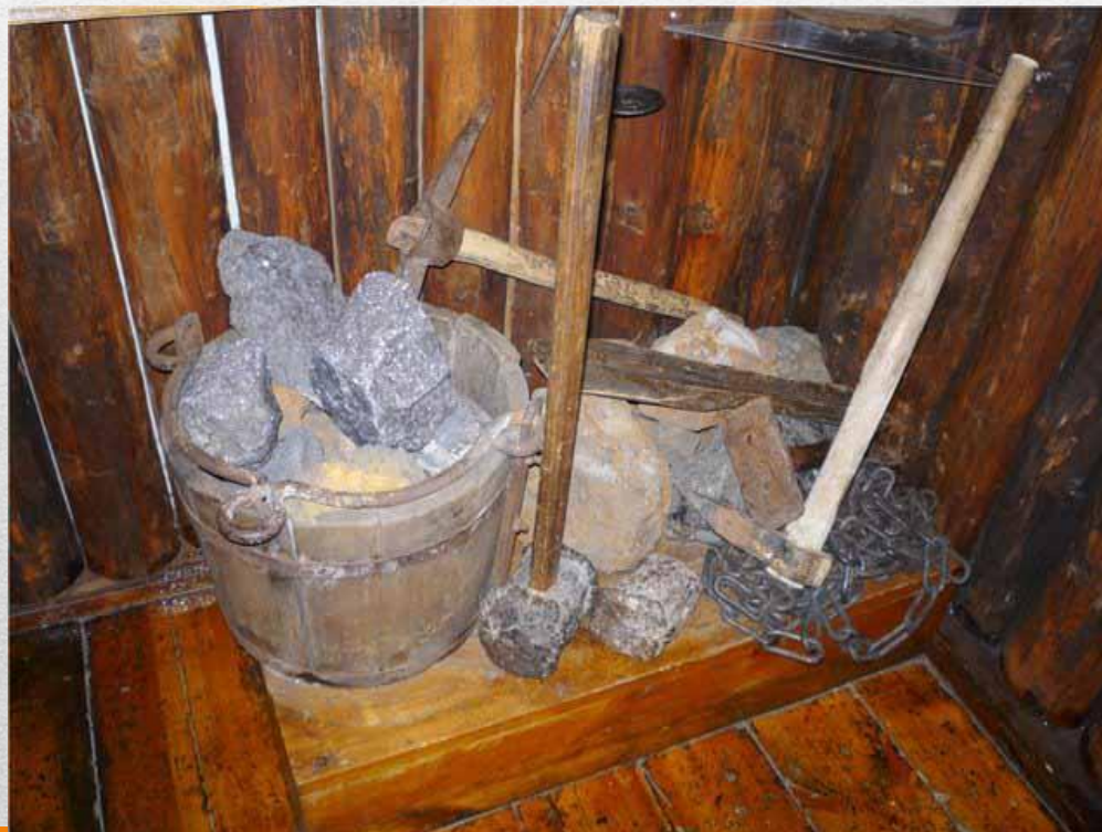
Каторжные орудия труда – Музей Декабристов

17 декабря он предстал перед приехавшими за ним посланцами Следственного комитета. Его объявили государственным преступником первого разряда, приговорили к смертной казни с отсечением головы. Смертная казнь была заменена 20 годами каторги и затем – вечным поселением в Сибири. Больше полутора лет Пущин провел в Шлиссельбургской крепости, потом был отправлен в Читту.