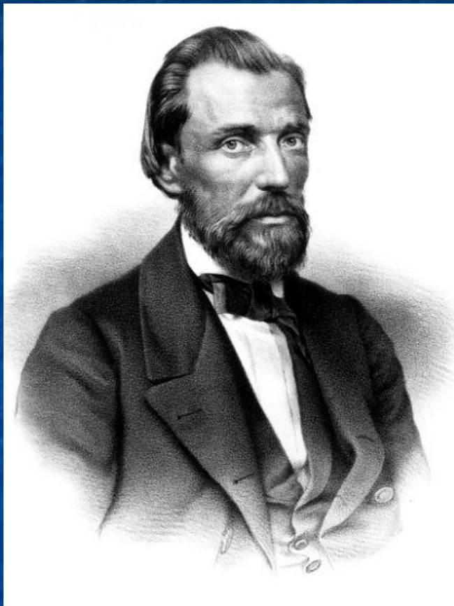
Иван Саввич Никитин 1824 - 1861