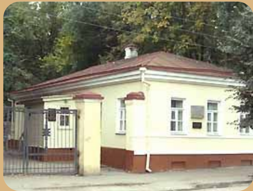
Дом И.С. Никитина

Стихи он стал писать очень рано, но долго не решался их напечатать, показать их другим. И первое напечатанное стихотворение Никитина «Русь» принесло ему известность, скоро он выпустил целый сборник своих стихотворений, на вырученные средства в 1859г. он открыл в Воронеже книжный магазин и при нём дешёвую библиотеку, ставшие центром литературной и общественной жизни города.