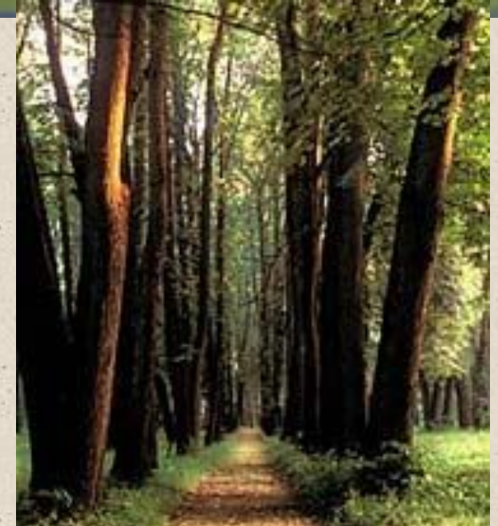
В.Колонтаева. «Воспоминания о селе Спасском».

...Спасское было в то время настоящим барским имением. Широкие, длинные аллеи из исполинских лип и берёз вели с разных сторон к господской усадьбе... за домом тянулся обширный, роскошный сад, густые, тёмные аллеи которого шли уступами к прудам, окаймлявшим сад и всю усадьбу.