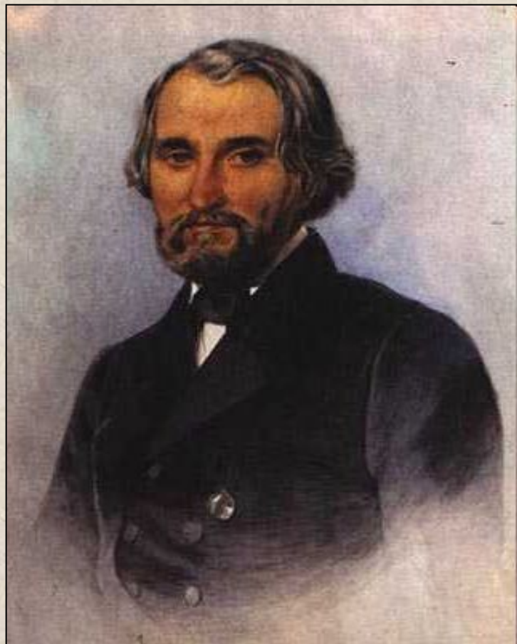
Иван Сергеевич Тургенев Большое благородное сердце 1818 - 1883