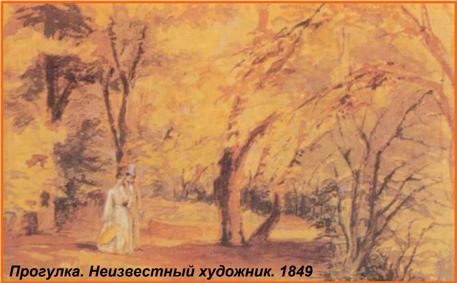
Прогулка. Неизвестный художник. 1849