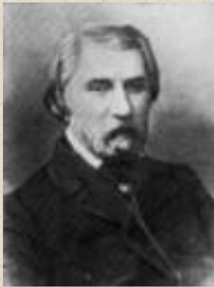
И.С.Тургенев. 1856г.

Тургенев... быстро угадывал новые потребности, новые идеи, вносимые в общественное сознание, и в своих произведениях непременно обращал (сколько позволяли обстоятельства) внимание на вопрос, стоявший на очереди и уже смутно начинавший волновать общество.