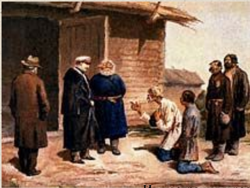
Иллюстрация к рассказу «Бурмистр». Художник П.П.Соколов.

«Записки охотника» - это книга о народной жизни в эпоху господства крепостного права.