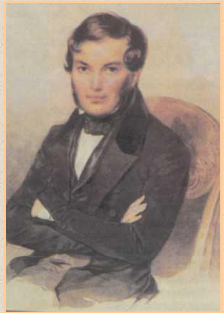
Портрет молодого человека со скрещенными руками. Художник П. Ф. Соколов. 1830-е годы

(художественные детали: «поражен в сердце», «жестоко меня уязвила», «краснощекий лейтенант»)