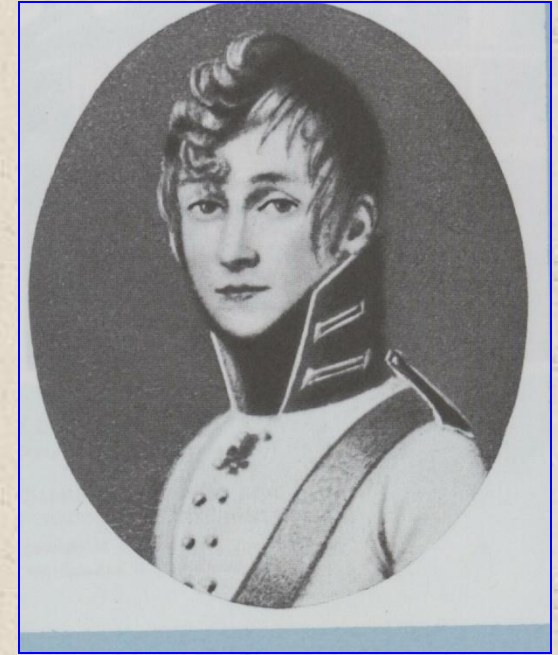
Отец: Сергей Николаевич

И.С.Тургенев родился 28 октября 1818 года в городе Орле. Семья будущего писателя жила деревенской, дворянской, медленной жизнью в обычной обстановке гувернеров и учителей, швейцаров и немцев.