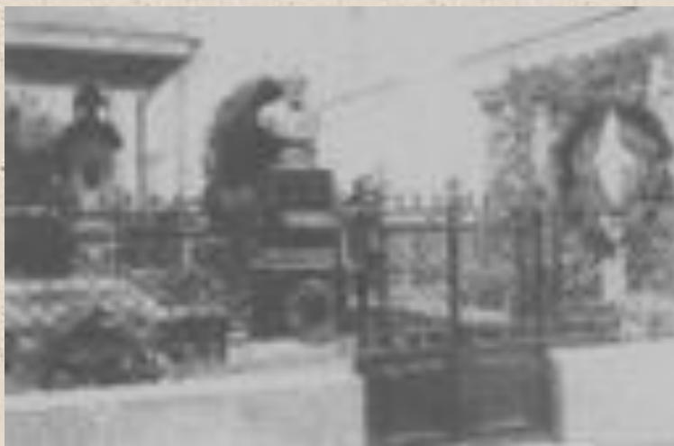
Могила И.С.Тургенева на Волковом кладбище в Ленинграде. Фотография.