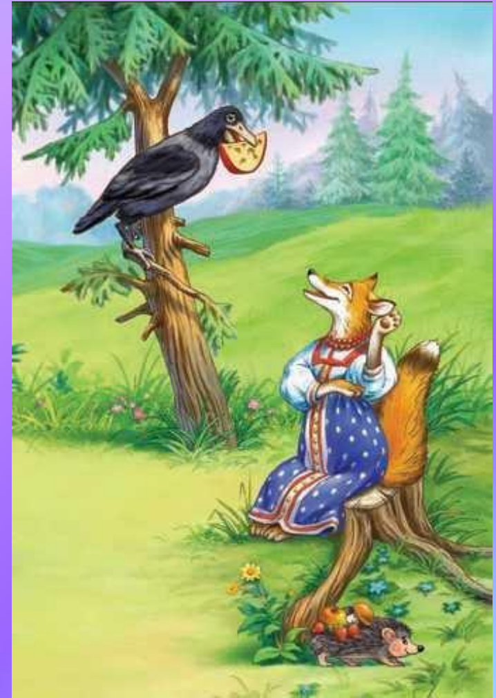
Ворона и Лисица