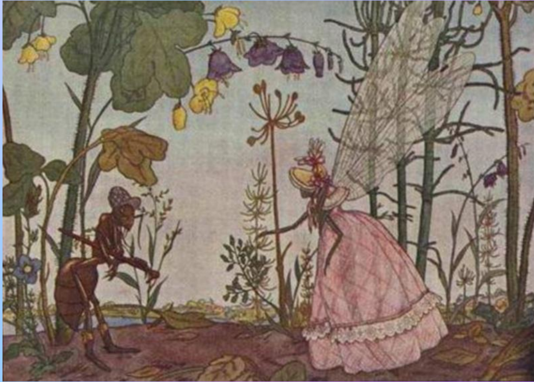
Стрекоза и Муравей