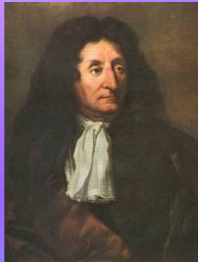
Жан де Лафонтен