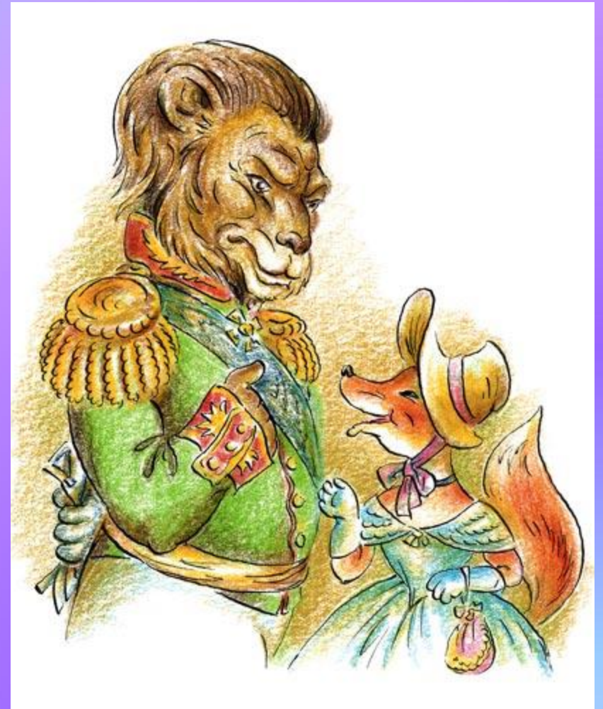
Лев и Лисица