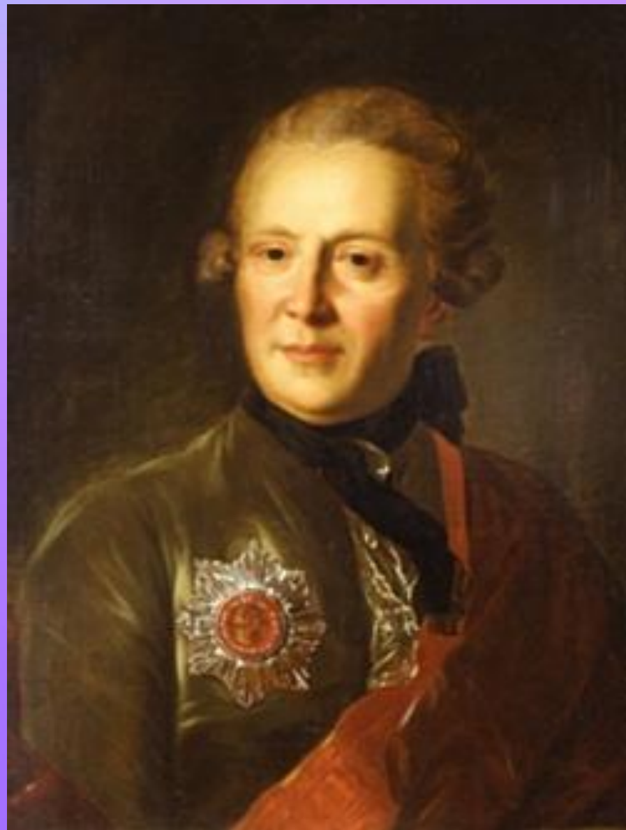
Александр Петрович Сумароков