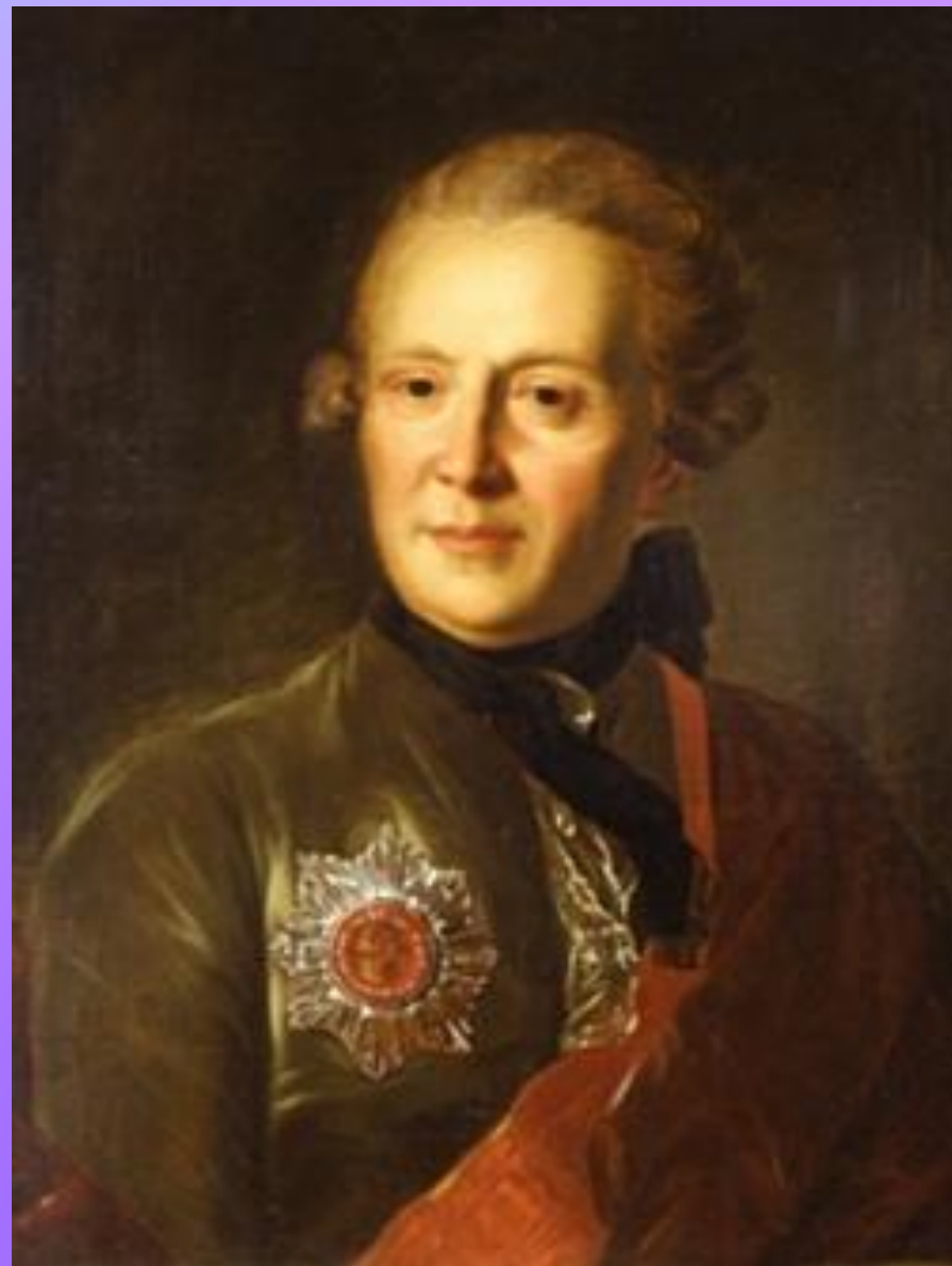
Александр Петрович Сумароков