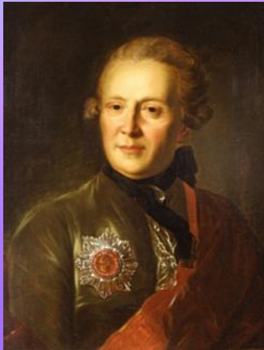
Александр Петрович Сумароков