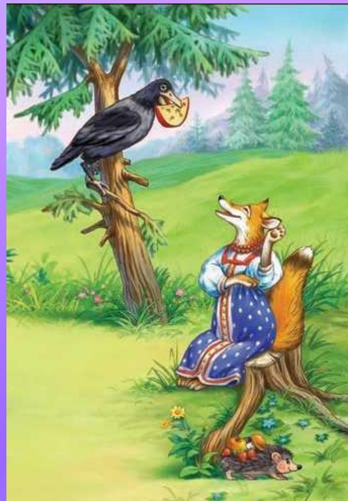
Ворона и Лисица