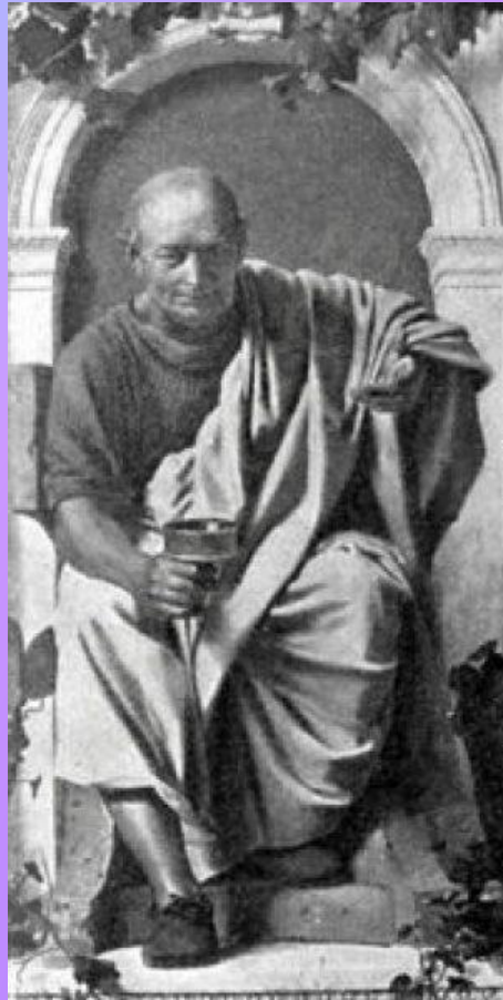
Гораций (полное имя Квинт Гораций Флакк)