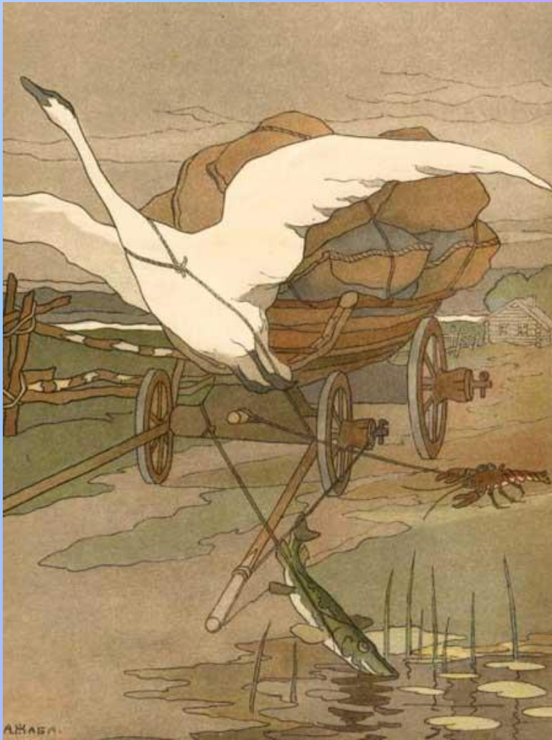
Лебедь, щука и рак