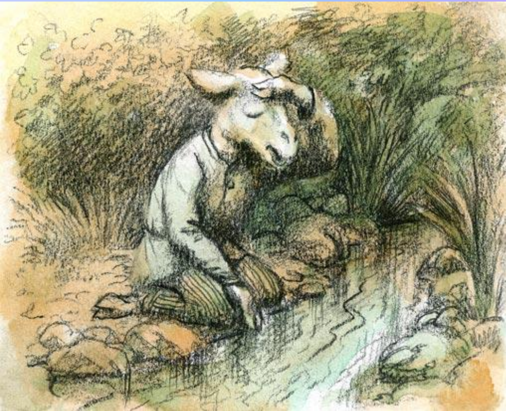
Волк и Ягненок