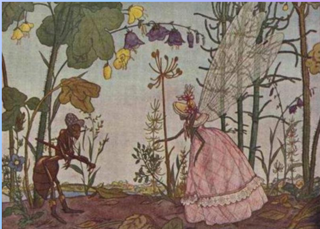
Стрекоза и Муравей