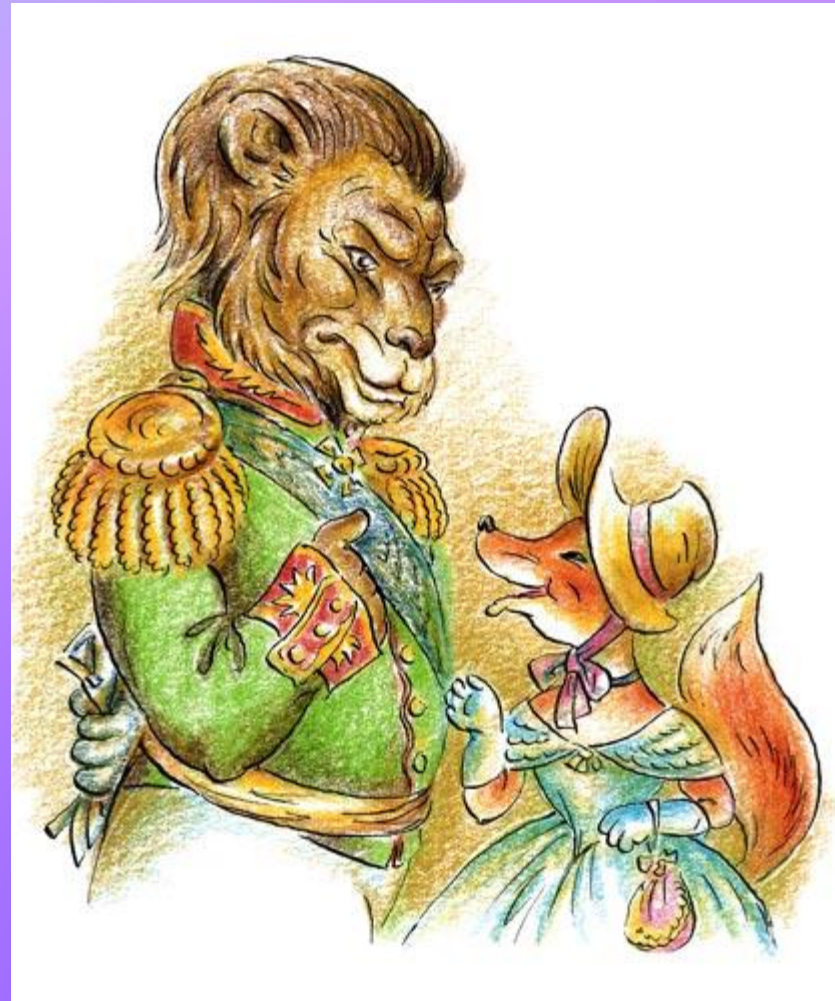
Лев и Лисица