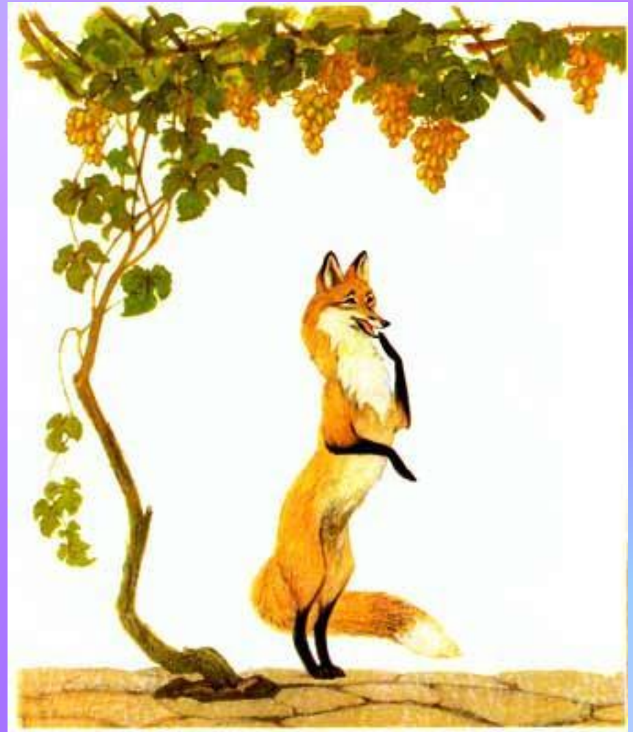
Лисица и виноград