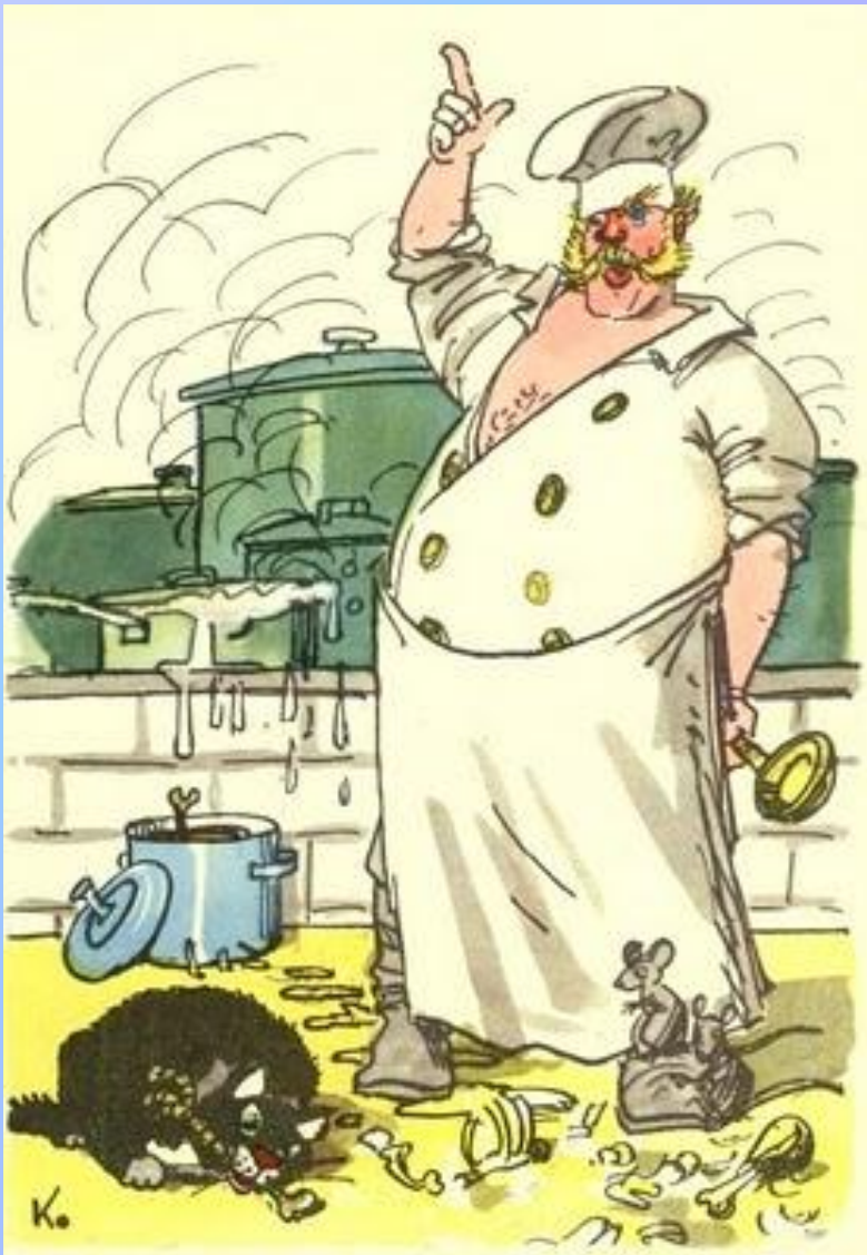
Кот и Повар