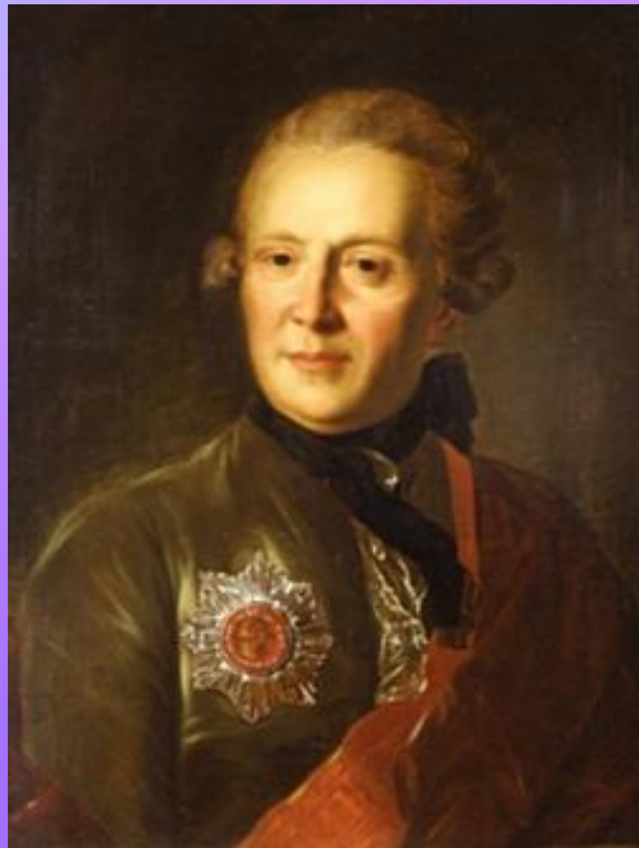
Александр Петрович Сумароков