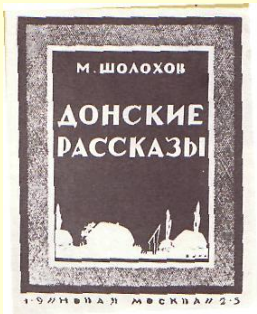
Обложка первого издания.