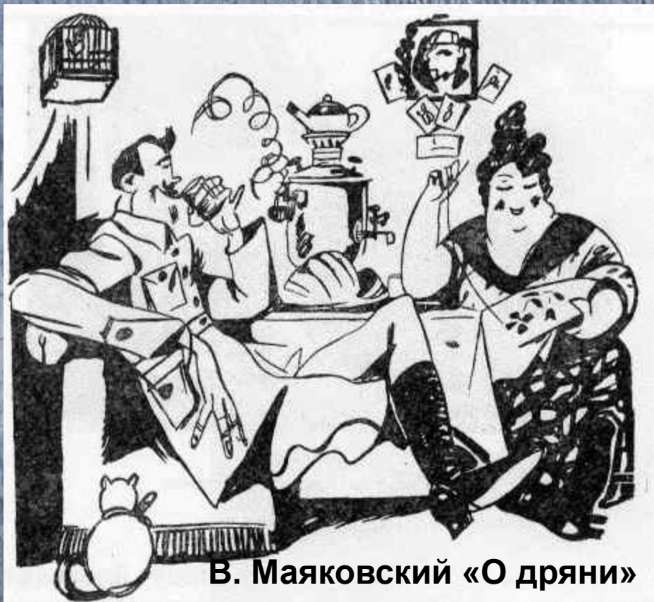
В. Маяковский «О дряни»