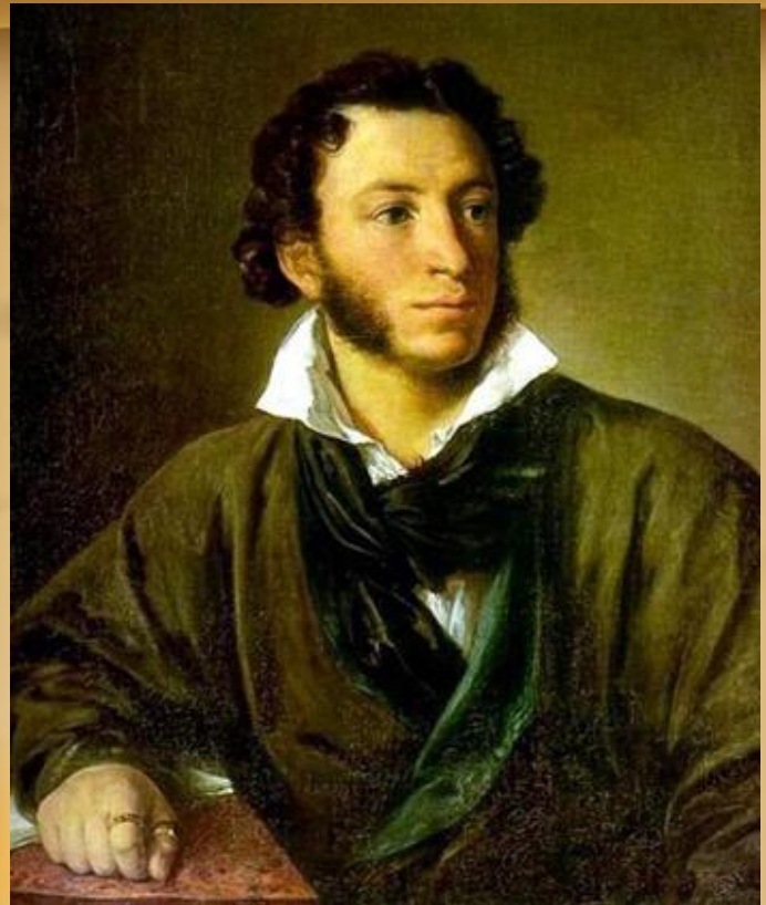
А. С. Пушкин (1799 — 1837).