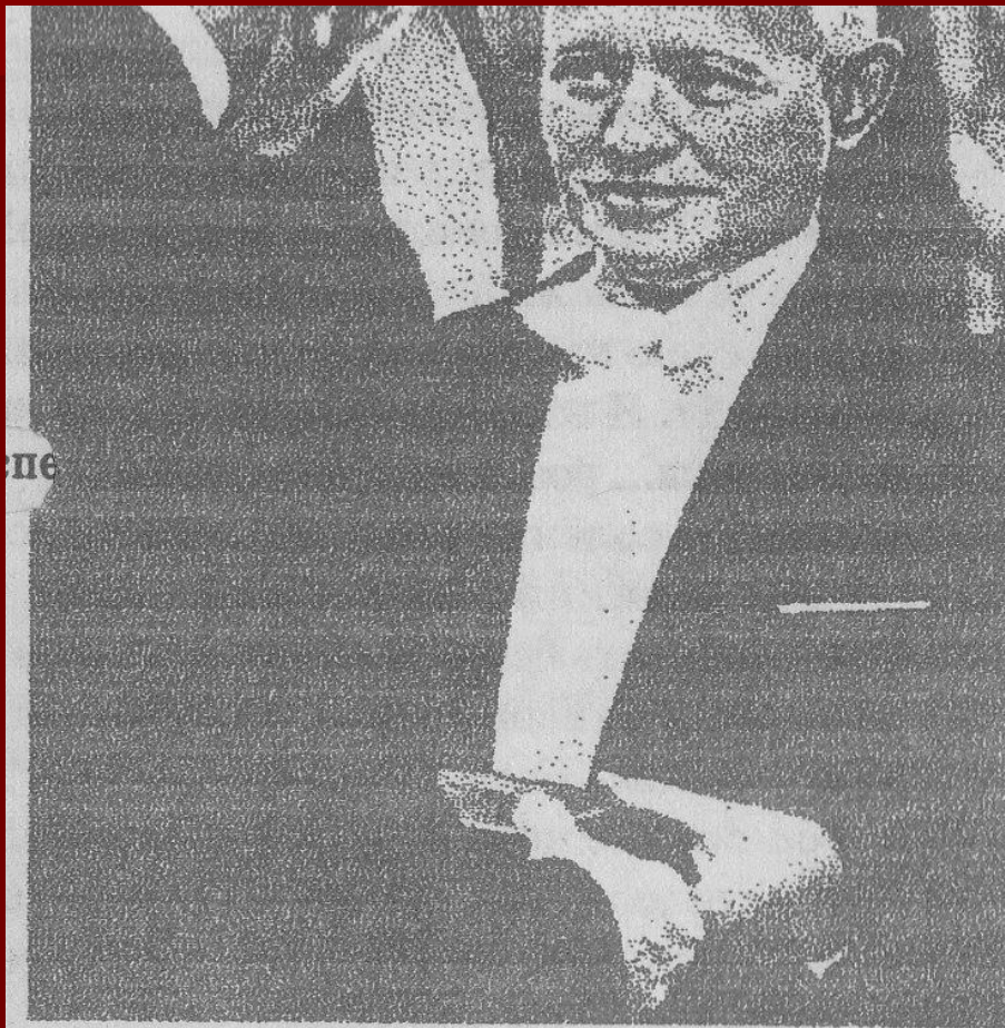
Вручение М.А. Шолохову Нобелевской премии, 1965 г.