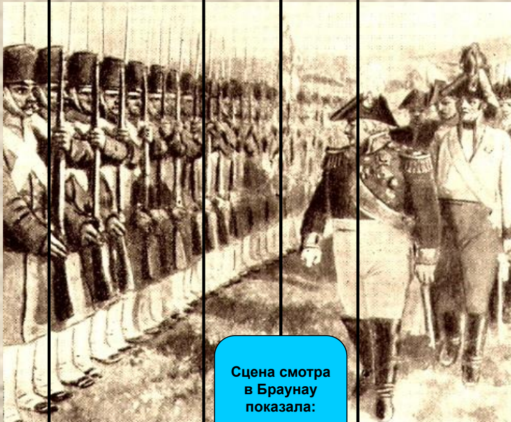
Сцена смотра в Браунау показала: