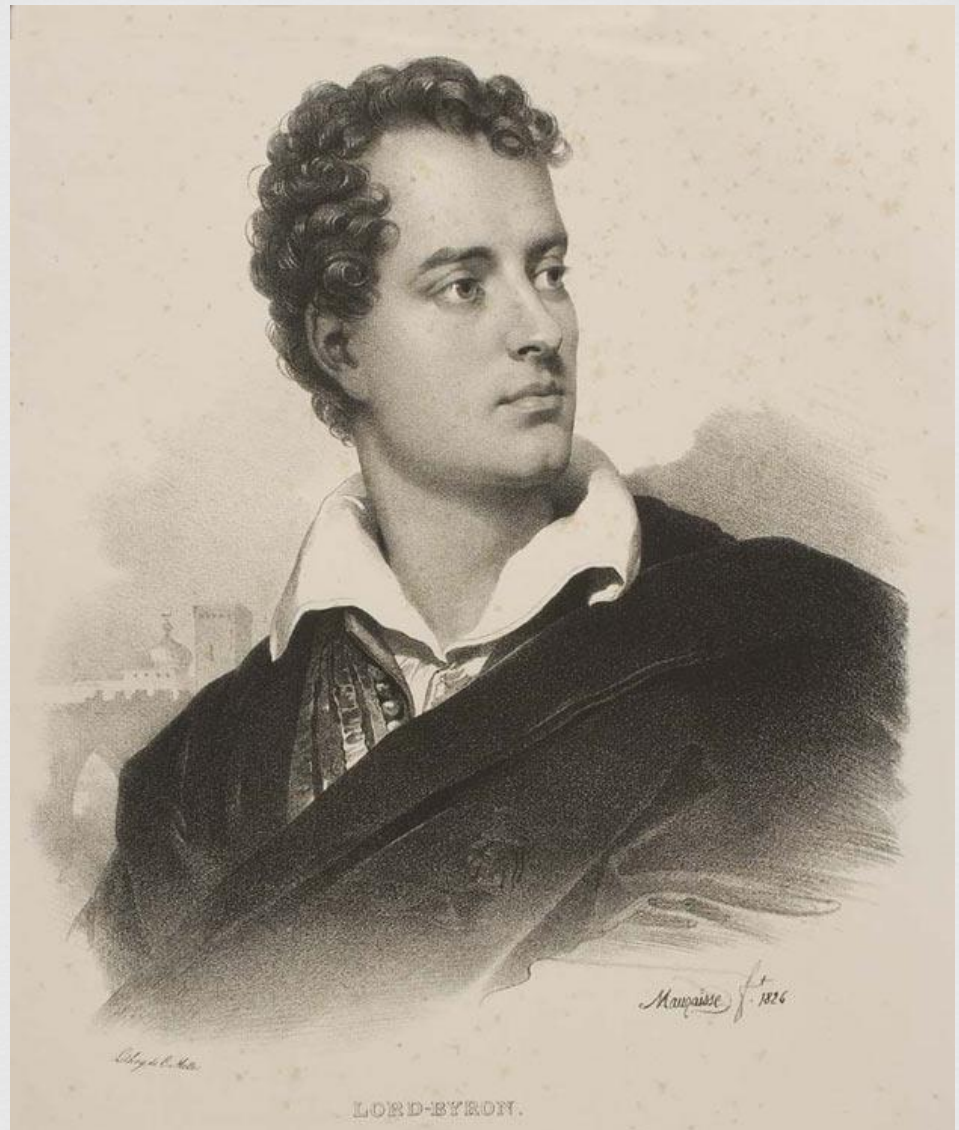
Джордж Гордон Ноэль Байрон

Но в сердце Чайльд глухую боль унес, И наслаждений жажда в нем остыла, И часто блеск его внезапных слез Лишь гордость возмущенная гасила. Меж тем тоски язвительная сила Звала покинуть край, где вырос он, - Чужих небес приветствовать светила; Он звал печаль, весельем пресыщен, Готов был в ад бежать, но бросить Альбион. Байрон. «Паломничество Чайльд-Гарольда».