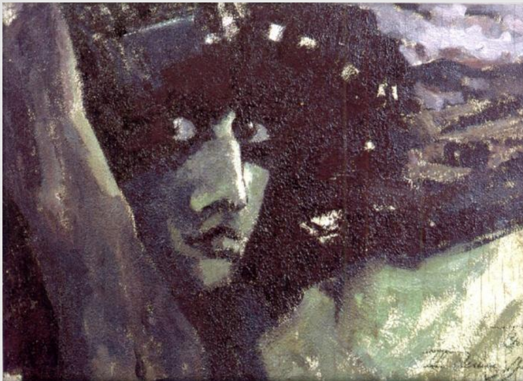
Михаил Врубель «Демон»

Люблю тебя не здешней страстью, Как полюбить не можешь ты: Всем упоением, всей властью Бессмертной