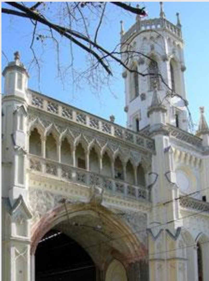
Вокзал в Петергофе архитектор Николай Бенуа