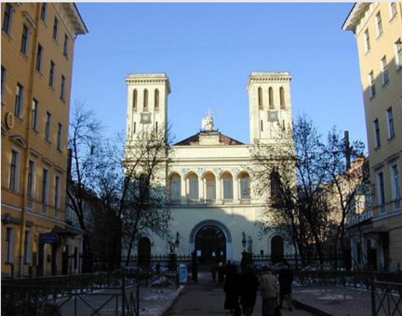
Лютеранская церковь в Петербурге Архитектор Александр Брюллов