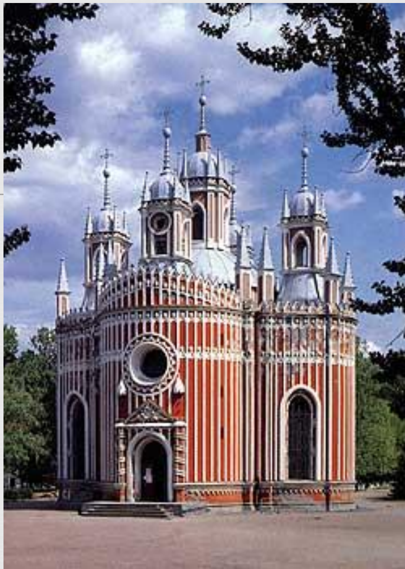
Чесменская церковь в Петербурге архитектор Юрий Фельтен