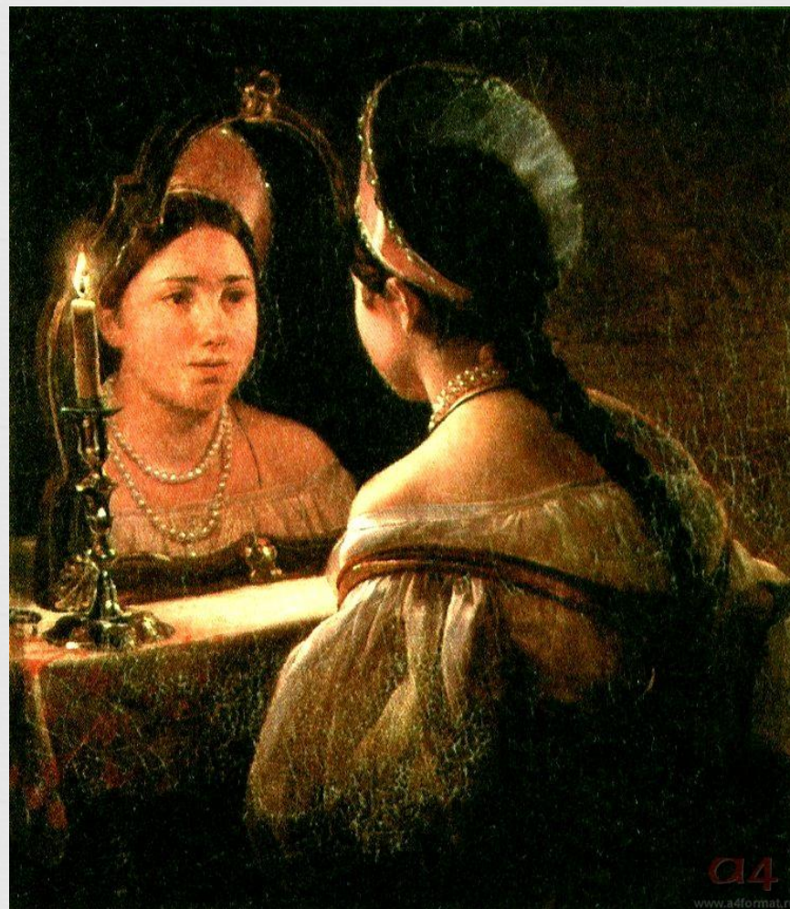
Карл Брюллов. Гадающая Светлана.

Вот красавица одна; К зеркалу садится; С тайной робостью она В зеркало глядится; Темно в зеркале; кругом Мертвое молчанье; Свечка трепетным