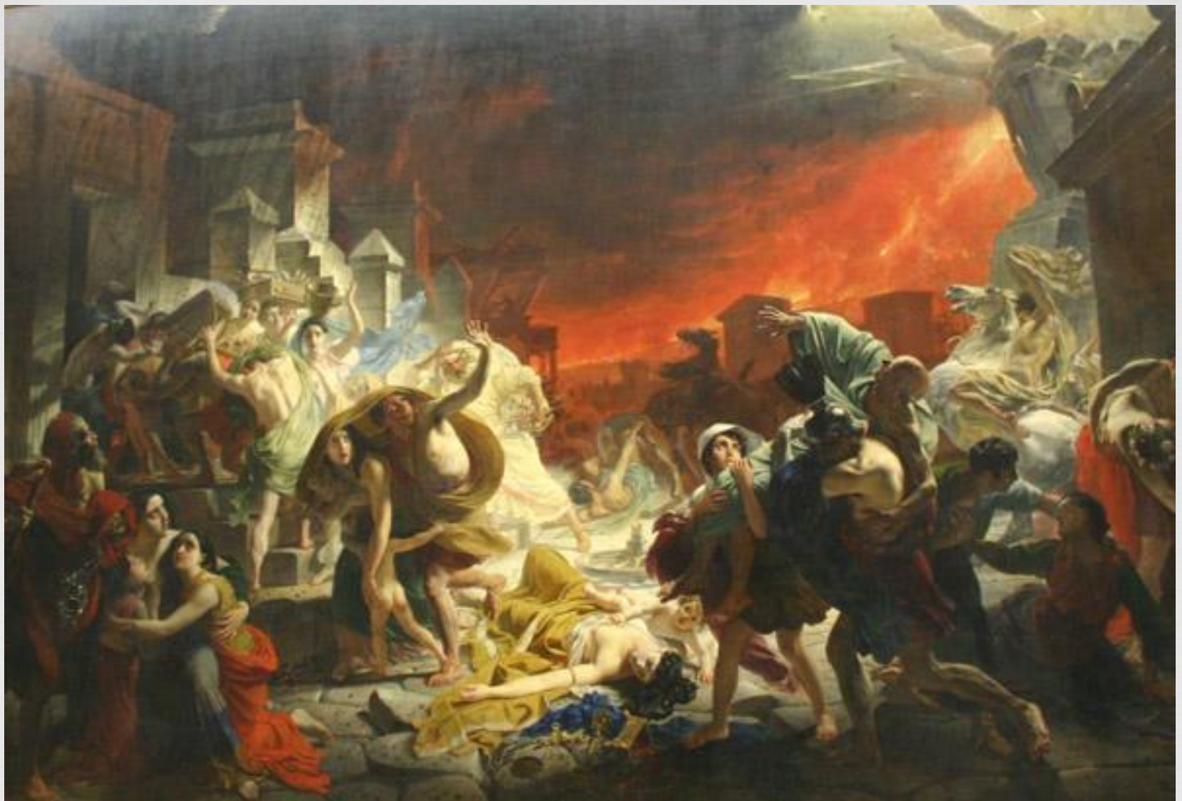
Карл Брюллов Последний день Помпеи