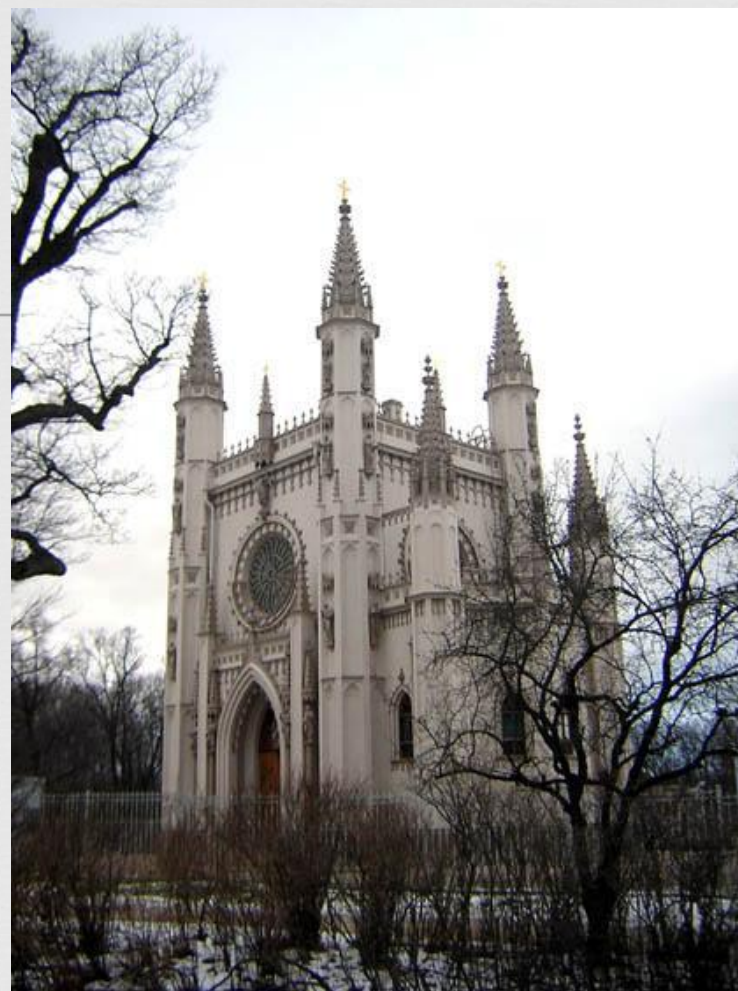
Готическая капелла парк Александрия Петергоф архитектор Карл Шинкель