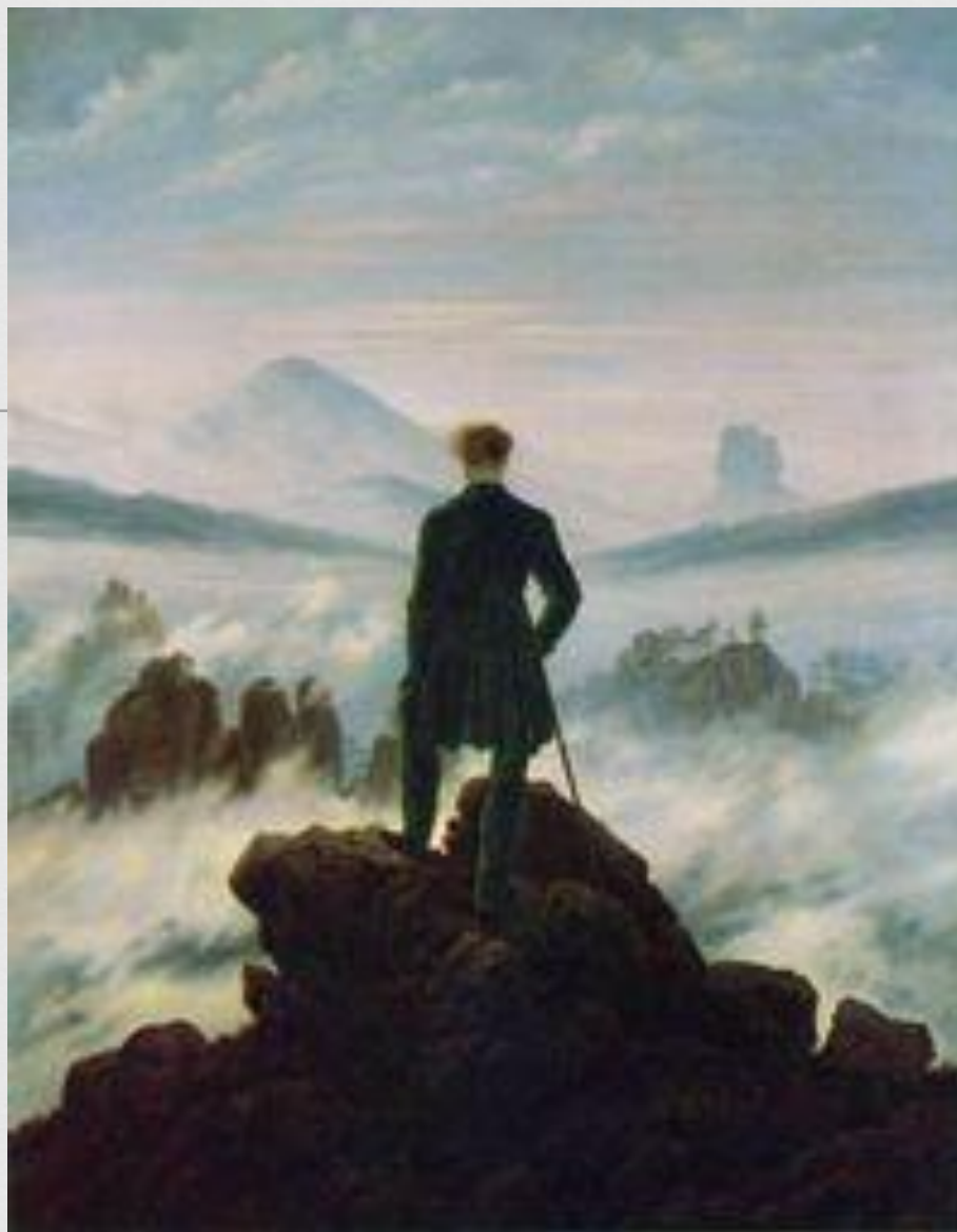
Каспар Фридрих Странник над туманным морем