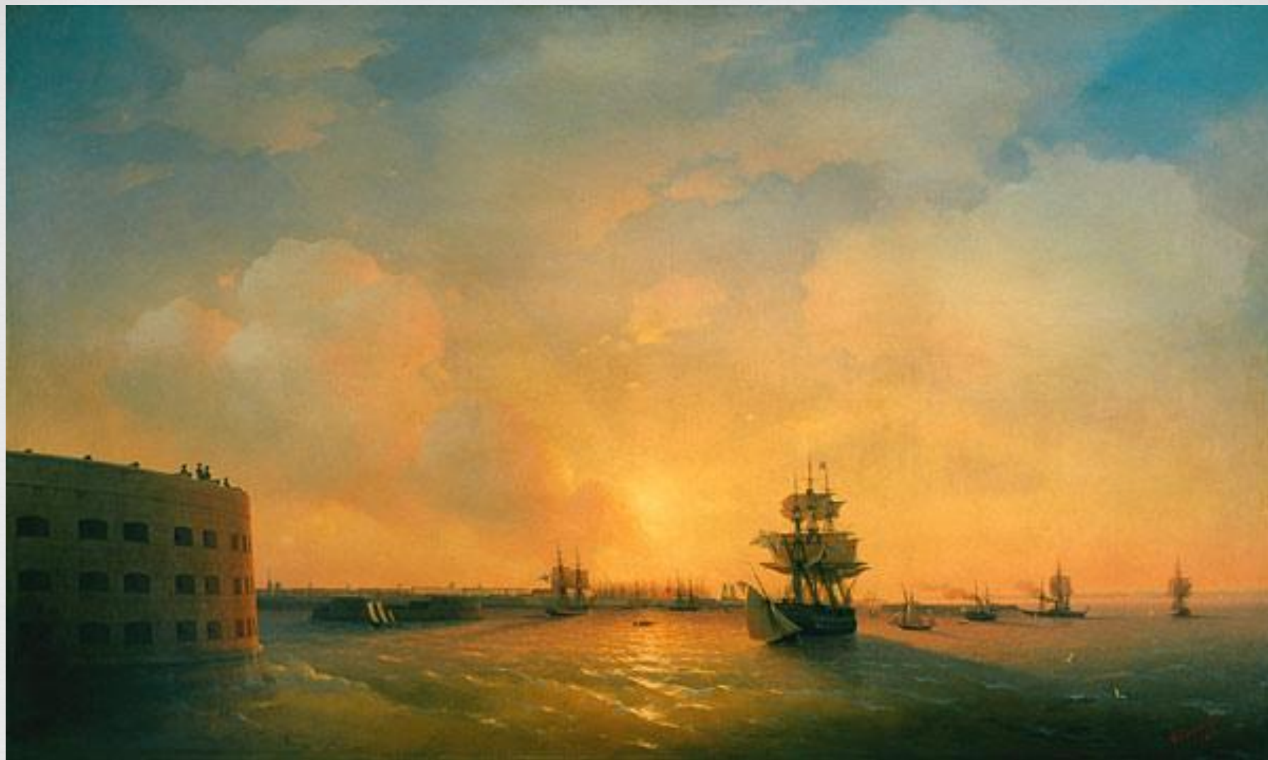
Иван Айвазовский Кронштадт. Форт император Александр