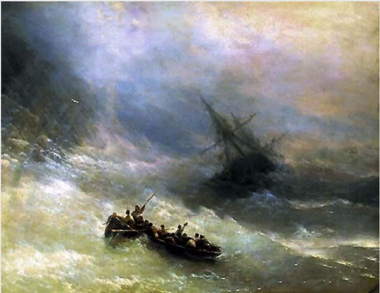
Иван Айвазовский Радуга