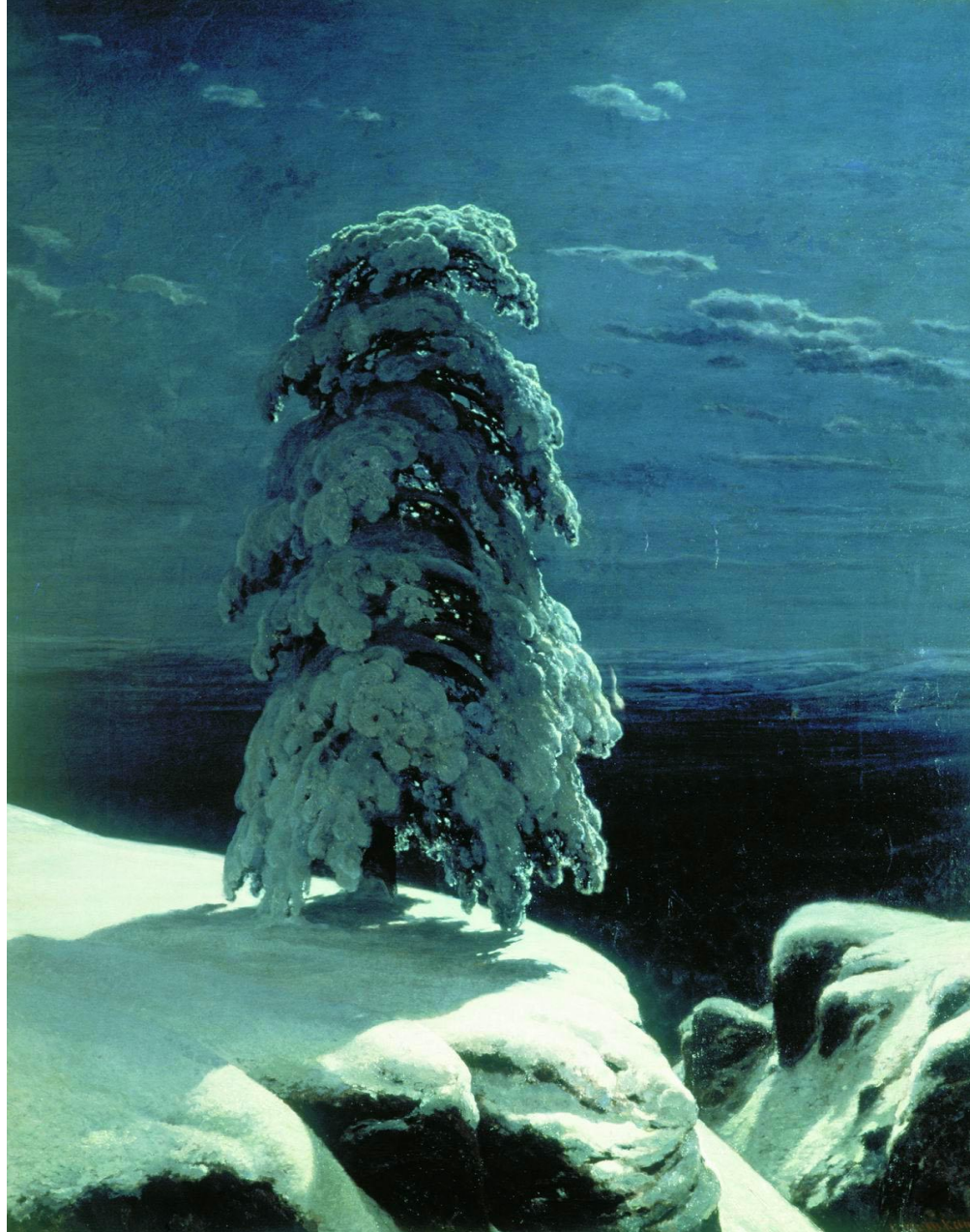
И.И. ШИШКИН « На Севере Диком»