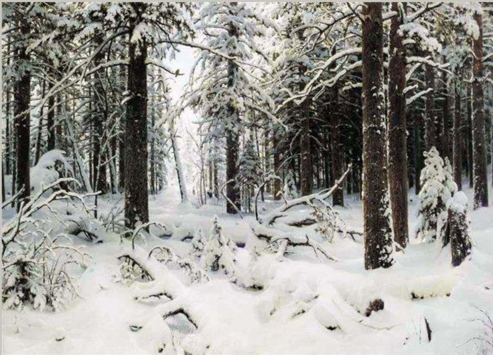
И.И. ШИШКИН « Зимний лес»