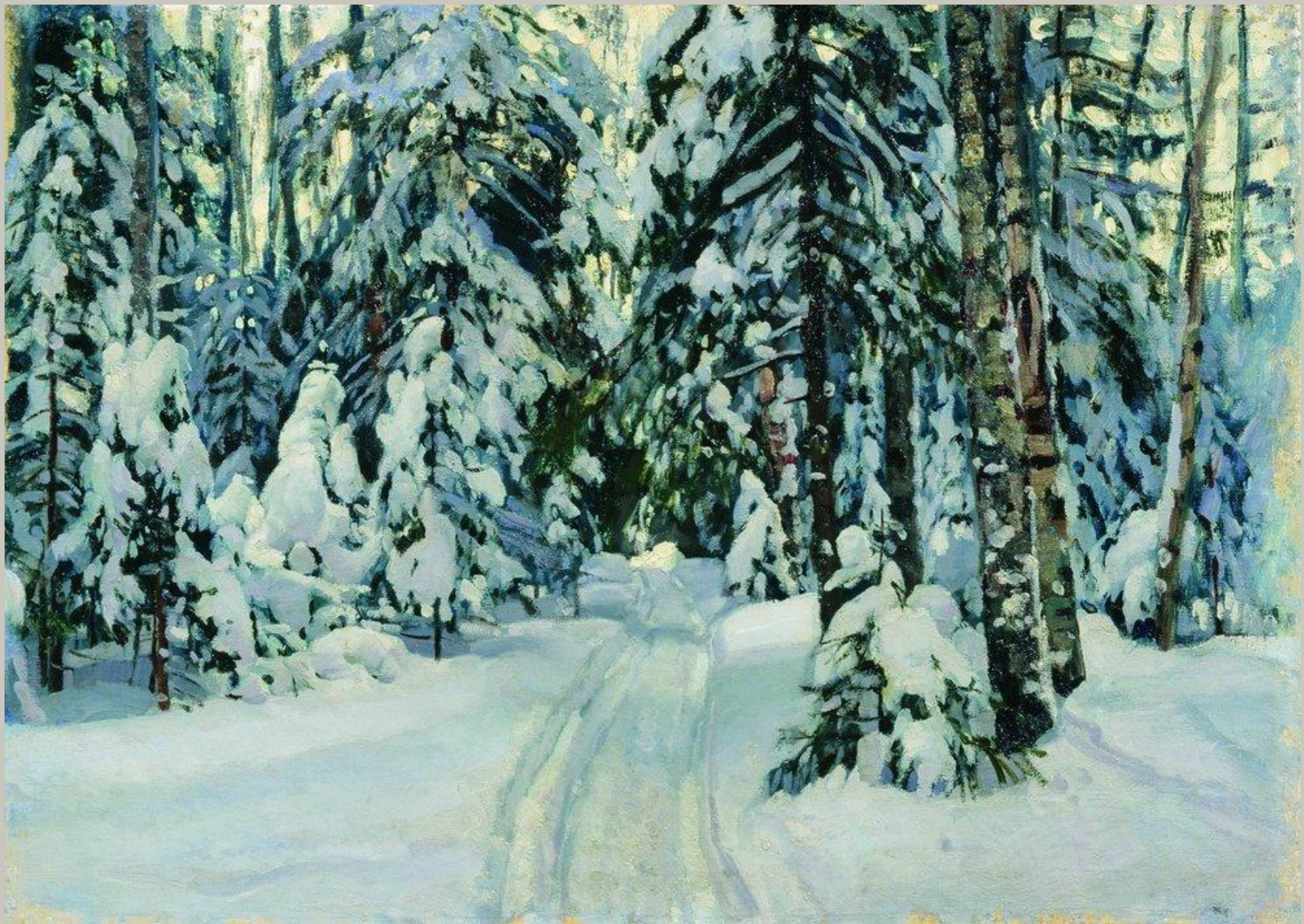
И.П. ПОХИТОВ « Русская зима»