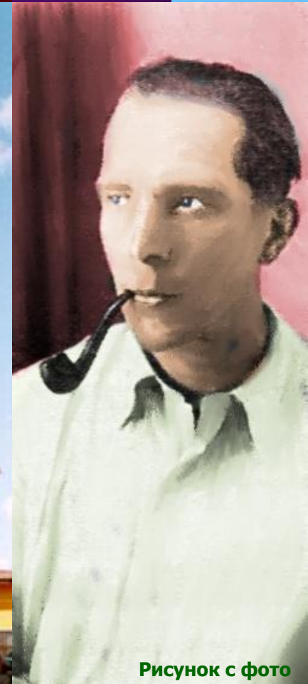
Рисунок с фото

Подробнее о самом Тартуском университете вы можете узнать на сайте www.ut.ee