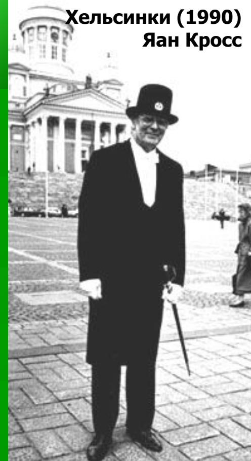
Хельсинки (1990) Яан Кросс

1994 – Государственная премия в области культуры за вклад в литературу