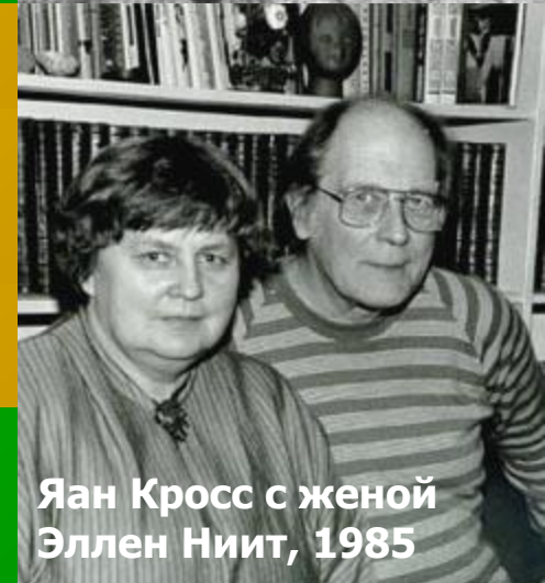
Яан Кросс с женой Эллен Ниит, 1985