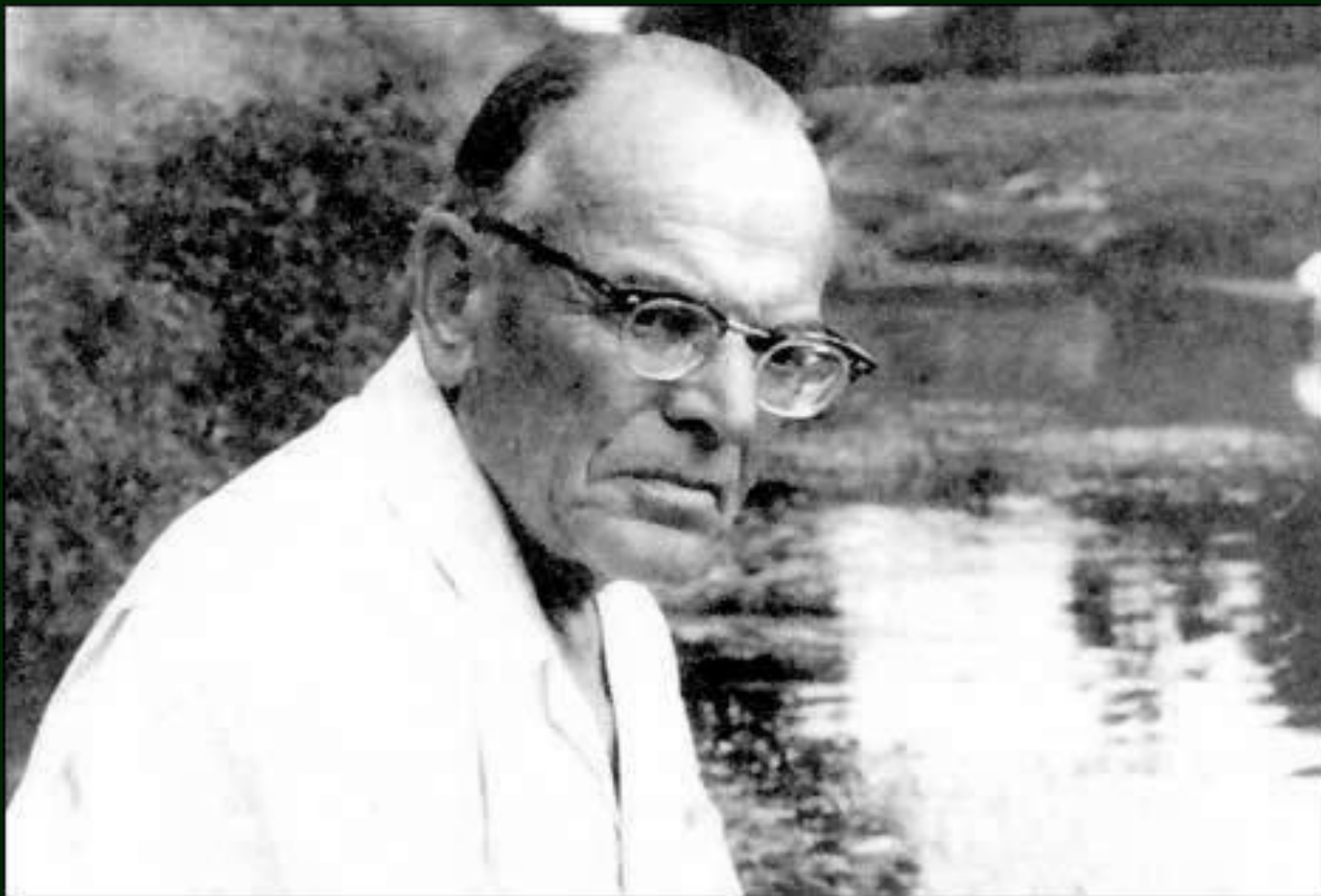
Паустовский Константин Георгиевич