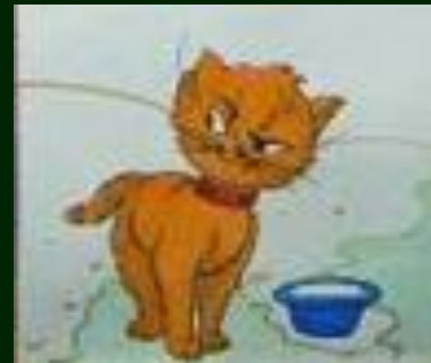
ХОЗЯИН И СТОРОЖ