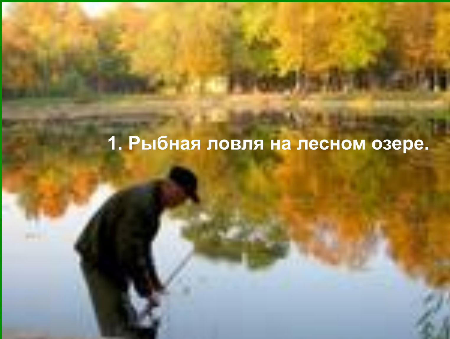
1. Рыбная ловля на лесном озере.