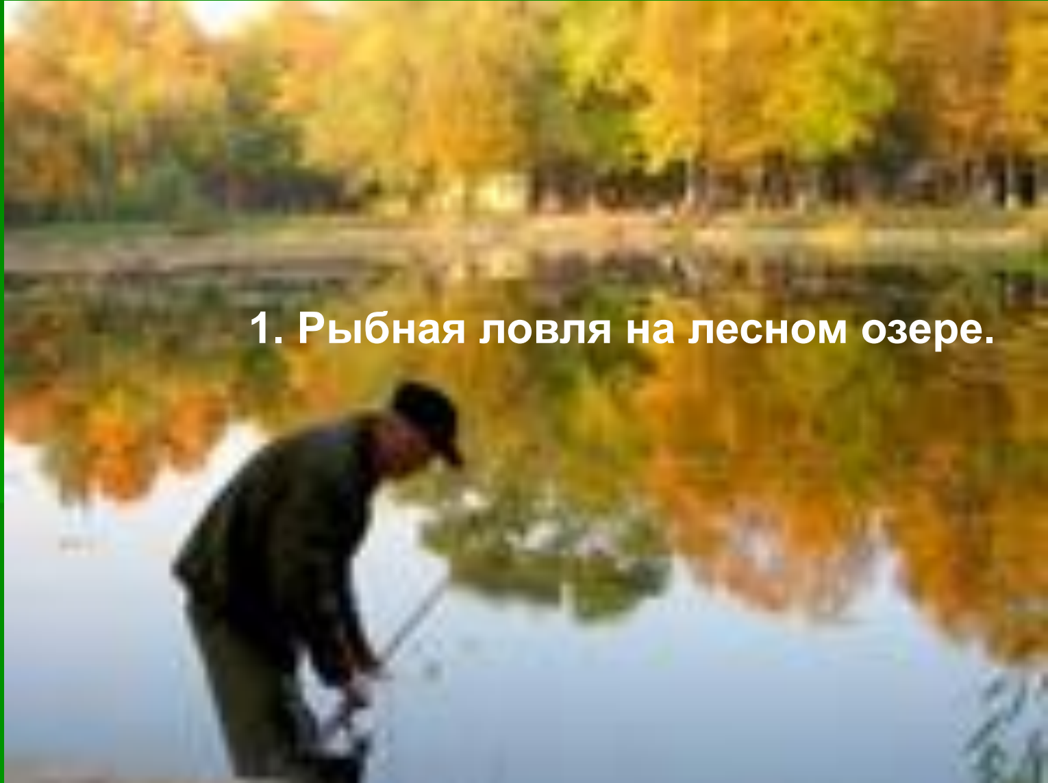
1. Рыбная ловля на лесном озере.