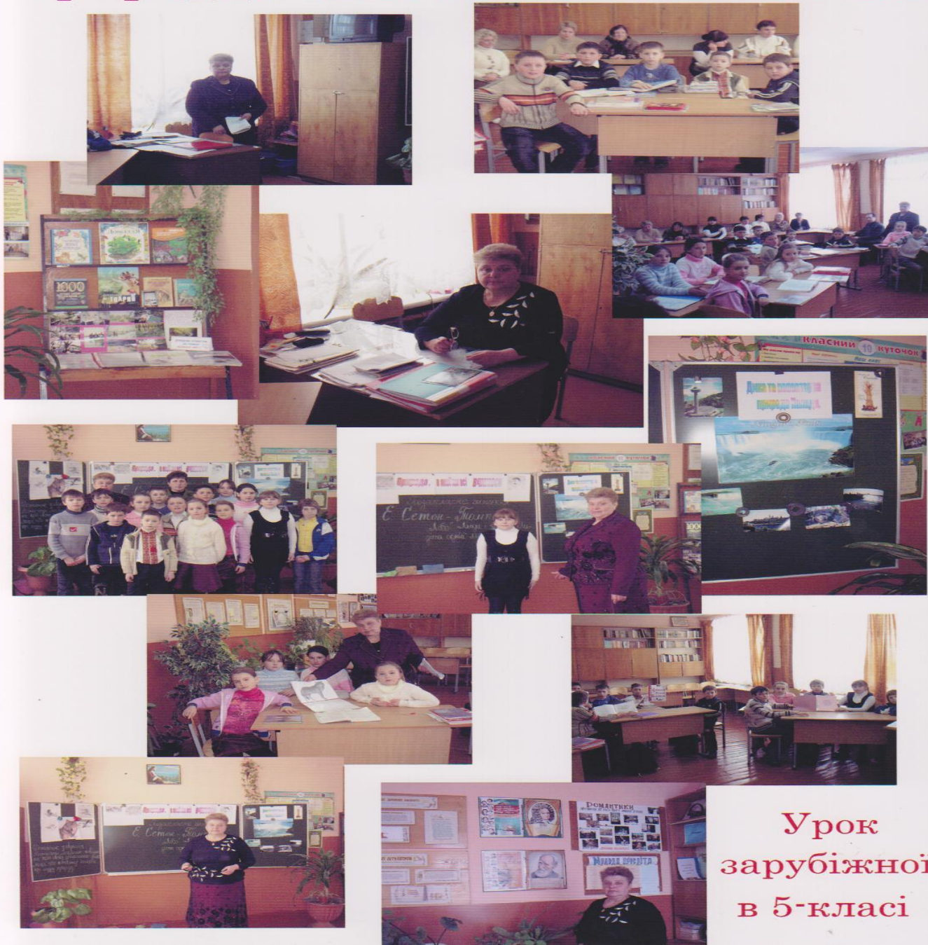
Урок зарубіжної в 5-класі