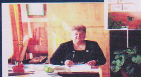
Кабінет зарубіжної літератури – моя творча лабораторія