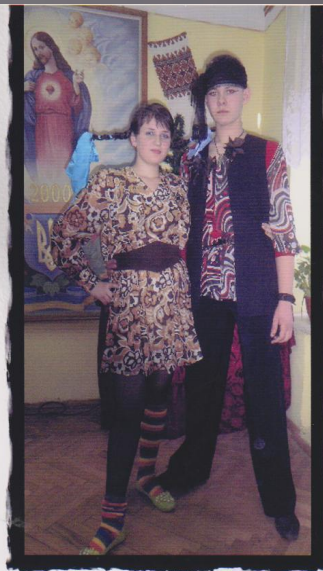
На подіумі літературні персонажі