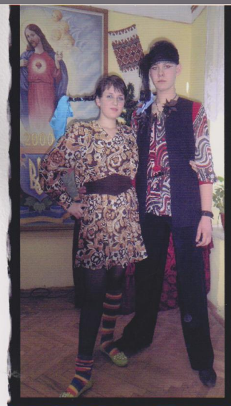
На подіумі літературні персонажі