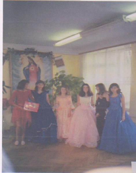
“Ромео і Джульєтта”

Ми любимо інсценізувати твори улюблених письменників