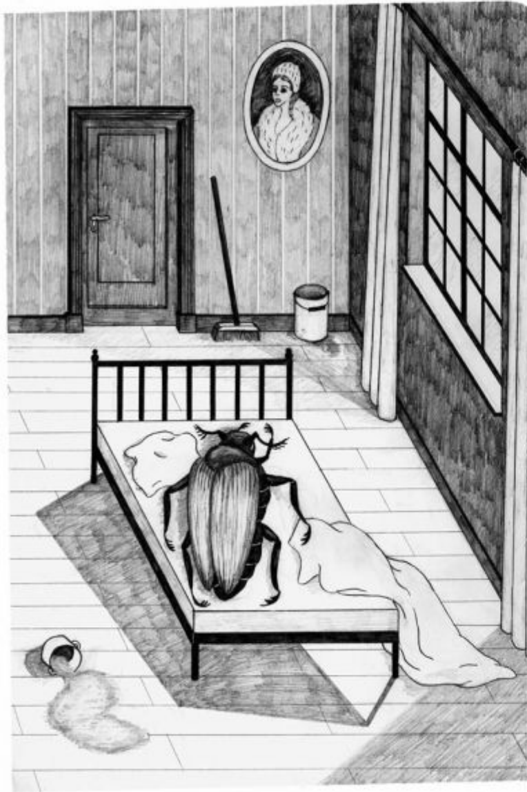
16 years old