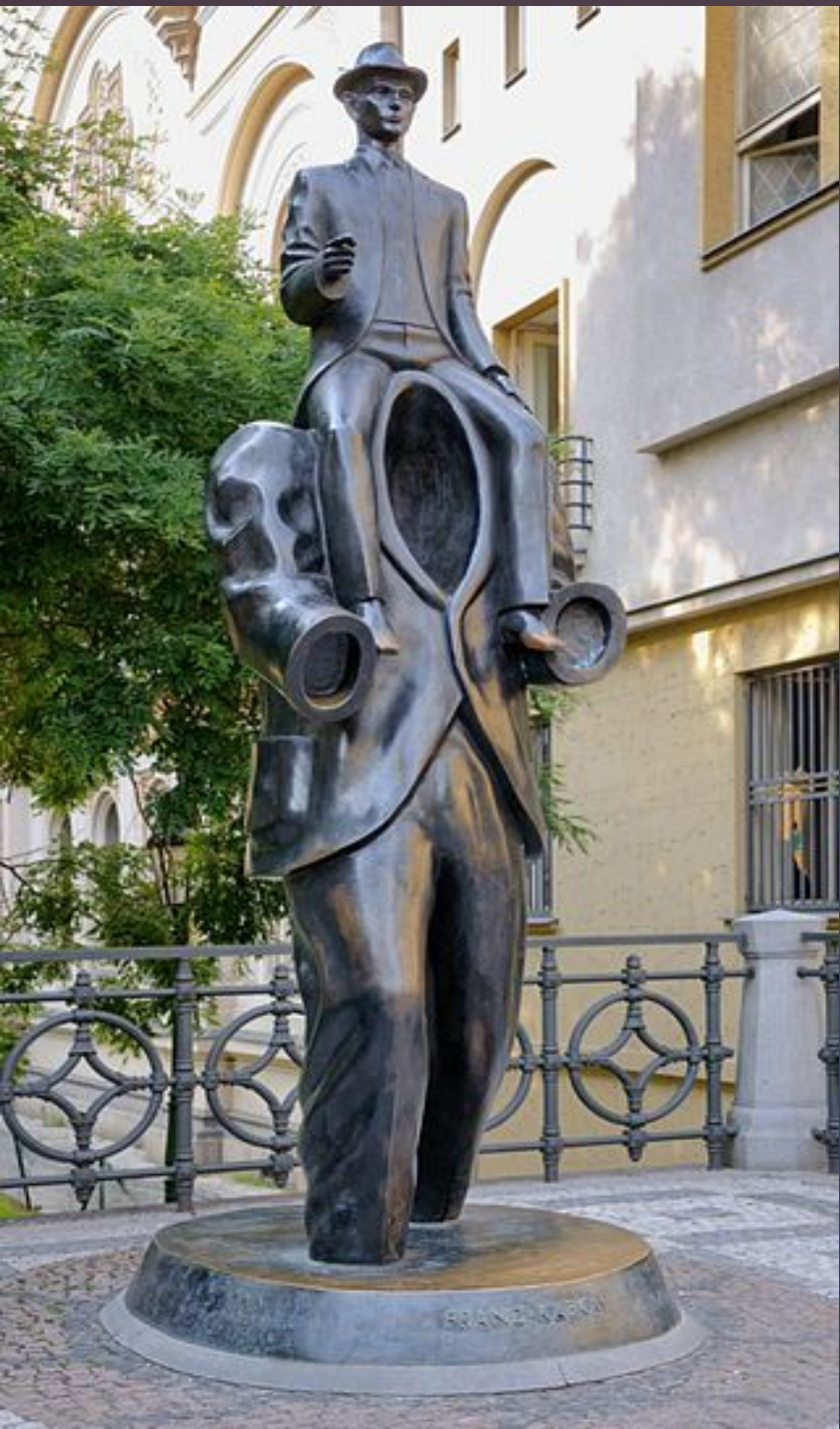
▣ Пам'ятник Францу Кафці (Прага)