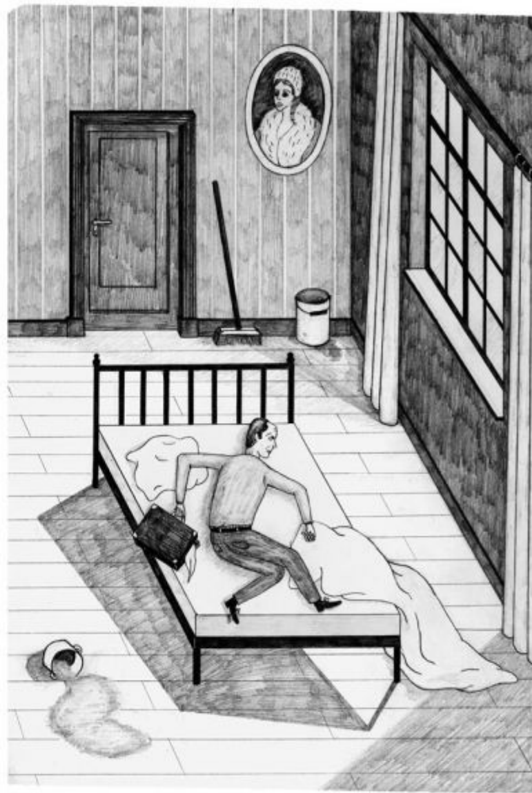
29 years old