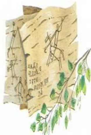
Письма на бересте