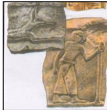
Письма в картинках