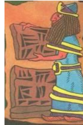
Письма на глине