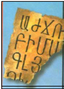
Письмо на пергаменте