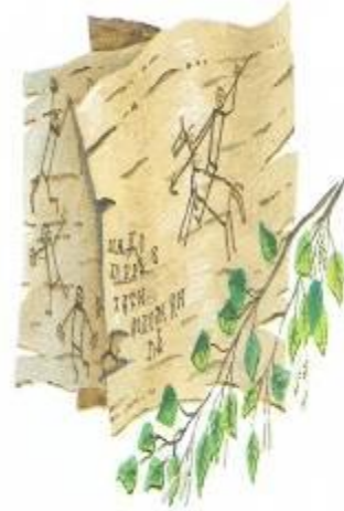
Письма на бересте