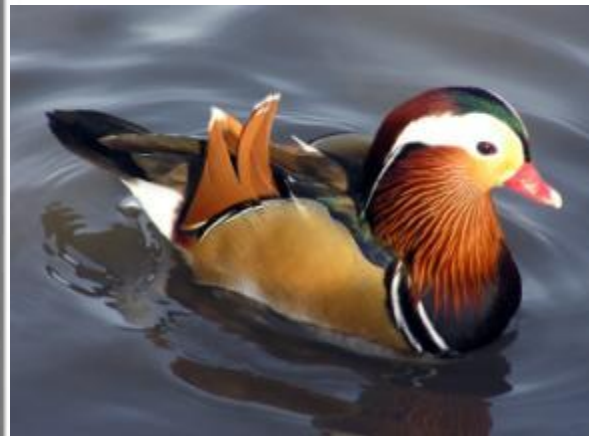
Уточка - чирок

Как отнеслись люди и птицы к словам смелого