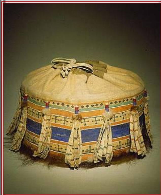
Короб для домашней утвари.