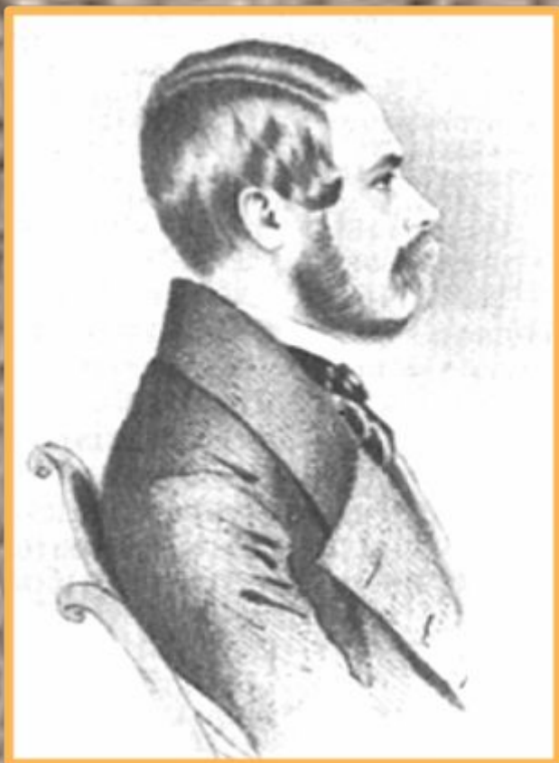
Николай Соломонович Мартынов