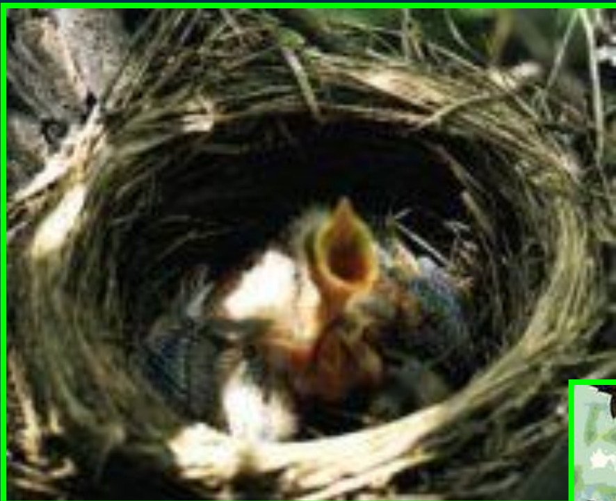
Гнездо дрозда рябинника