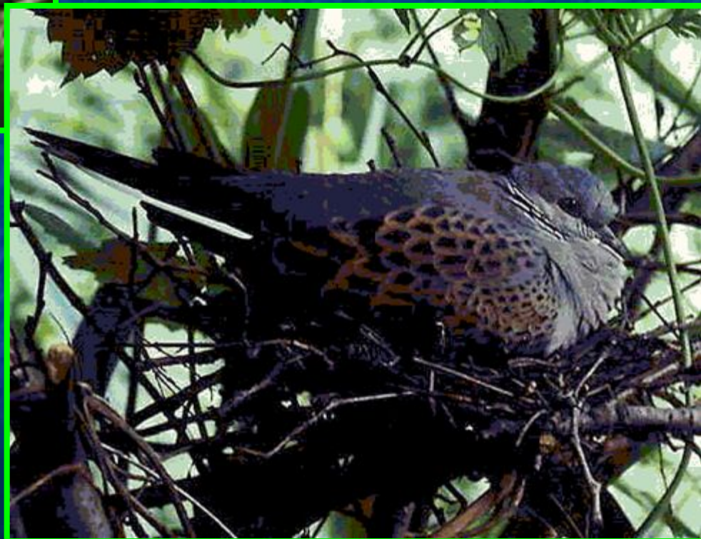
Горлица на гнезде